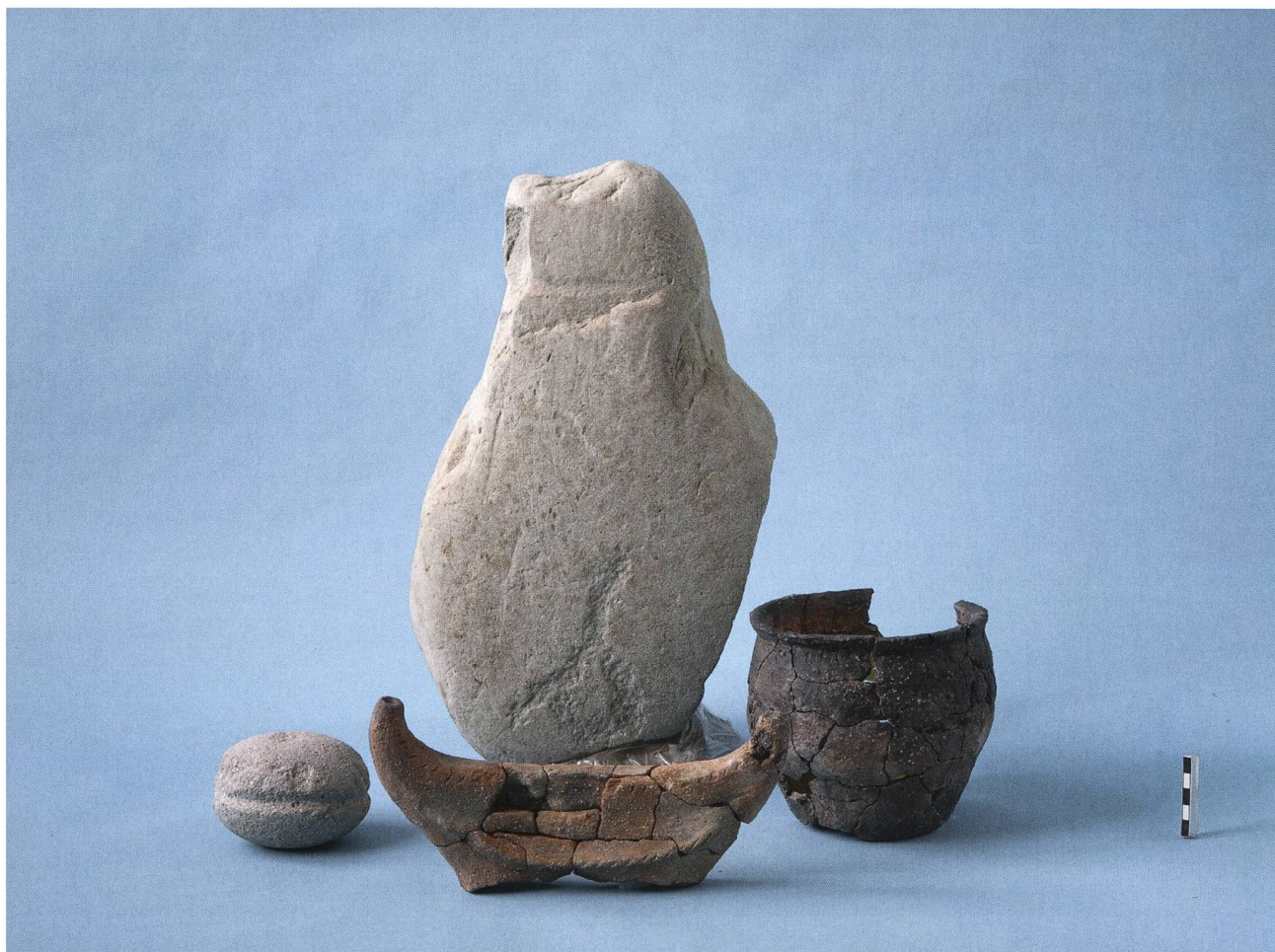
Abb. 1. Cham-Oberwil ZG, «Äbnetwald». Auswahl an Funden aus der spätbronzezeitlichen Grube: Rillenstein, Steinstele, Mondhorn, Keramikgefäss.

zeigt unser Stück eine eingepickte Darstellung 10 . Aufgrund der starken Abstraktion ist nicht auszumachen, worum es sich handelt: Dolchfutteral mit Schlaufe, Axt, Bestandteil der Kleidung, männliches Geschlechtsorgan oder etwas anderes (z. B. Tier)? Auch wenn wir die Darstellung vorläufig nicht zu lesen vermögen, ist es offensichtlich, dass sie nicht natürlichen Ursprungs ist, dies im Gegensatz zu den Kratz- und Schliffspuren auf der Rückseite. Diese deuten wir als Gletscherschliff, was die Herkunft des Sandsteinblocks aus dem lokalen eiszeitlichen Moränenschotter nahelegt. Die Grube enthielt ausschliesslich spätbronzezeitliche Funde, weshalb für die Steinstele von einem analogen Alter auszugehen ist 11 . Die Interpretation des Sandsteinblocks als menschenartige Kleinskulptur geschah nicht direkt auf der Grabung, sondern entstand erst danach. Aufgrund des Vorhandenseins typischer Elemente des Darstellungsprinzips von anthropomorphen Stelen erachten wir die Deutung zwischenzeitlich als gesichert.