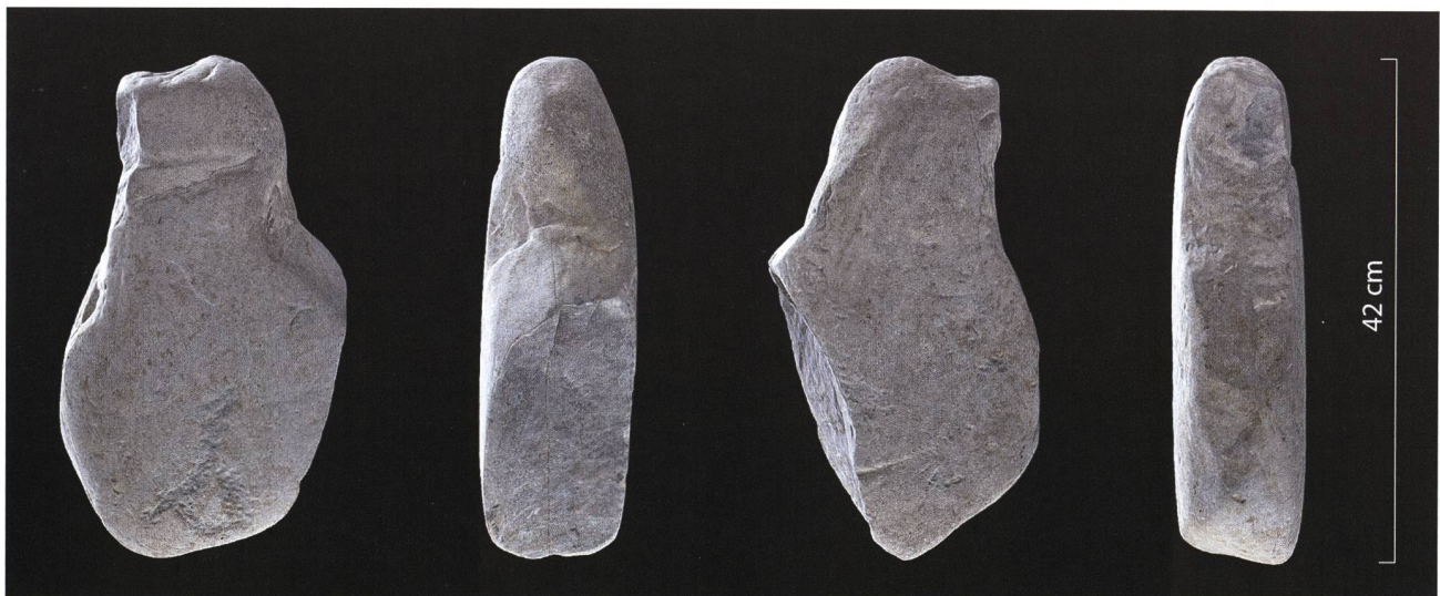
Abb. 3. Cham-Oberwil ZG, «Äbnetwald». Unter Ausnutzung der natürlichen Form des Sandsteinblocks und mittels künstlicher Bearbeitung wurde in der Silhouette eine stilisierte anthropomorphe Form erzielt. Die Schauseite zeigt intentionell vorgenommene Bearbeitungen: Eine horizontal verlaufende, eingeschliffene Halsrinne trennt Kopf und Rumpf, im unteren Bereich befindet sich eine in den Stein gepickte Figur. Die Spuren auf der Rückseite dürften natürlichen Ursprungs sein (u.a. Gletscherschliff). Ansichten abgeleitet aus einem photogrammetrischen 3D-Modell der Stele, vgl. https://sketchfab.com/ADA-ZG/collections/cham-oberwil-abnetwald-steinstele .