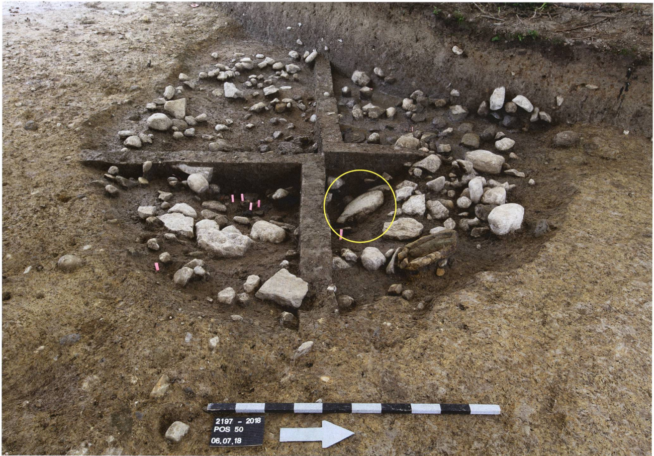
Abb. 2. Cham-Oberwil ZG, «Äbnetwald». Die spätbronzezeitliche Grube zu Beginn deren Freilegung. Die rosafarbenen Markierungen kennzeichnen Keramikscherben. Die nach vorne gekippte Steinstele ist im Quadranten vorne rechts erkennbar (mit Kreis markiert). Im Fundzustand unterschied sie sich nicht von den übrigen Feldsteinen und war nicht als menschliches Artefakt erkennbar.