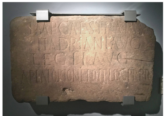
Abb. 4. Bauinschrift des Hadrianswalls aus Milecastle no. 38. Genannt werden der Kaiser Hadrian, die Legio II Augusta und der amtierende Statthalter der Provinz Britannia Aulus Platorius Nepos.

In den Quellen des 1. Jahrhunderts n. Chr. kann der Begriff limes mit Schneise oder Militärstrasse gleichgesetzt werden. In einem militärisch-administrativem Sinn ist limes erstmals bei Velleius Paterculus zu fassen und wird als Militärstrasse übersetzt 30 . Ab dem späten 1. Jahrhundert n. Chr. kommt eine weitere Bedeutung hinzu, nämlich die eines Grenzgebietes (das sich entlang einer Strasse oder Fluss erstrecken kann) 31 .