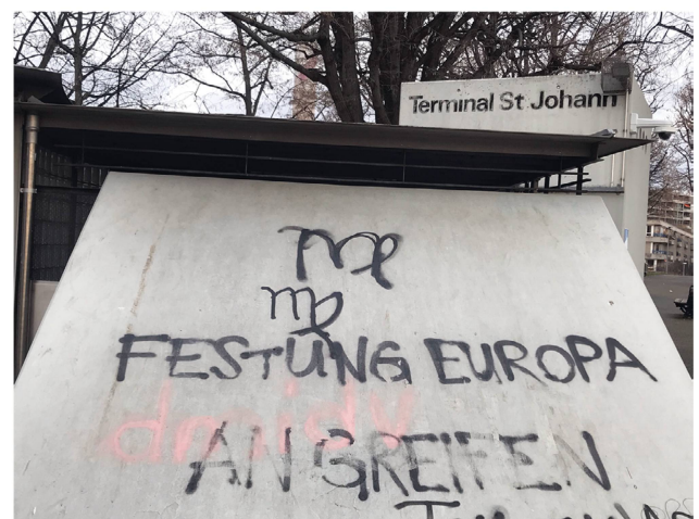
Abb 1. Ob auf einem Werbeplakat oder als Graffiti in der Stadt anzutreffen – Grenzen sind heute allgegenwärtig.