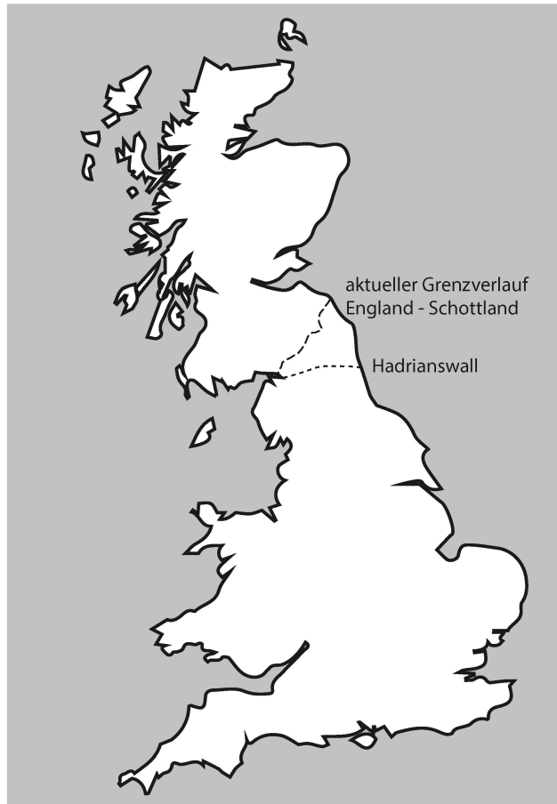
Abb. 3. Karte von Grossbritannien. Eingezeichnet ist der Verlauf von Hadrianswall und die moderne Grenze zwischen England und Schottland. Karte: Autor.

Lower Isthmus, Extending from the Tyne to the Solway, deduced from numerous personal surveys». Im ersten Kapitel gibt er einen historischen Überblick über die römische Besatzung Britanniens. Vor allem am Schluss von diesem ersten Kapitel werden Parallelen gezogen und Brücken geschlagen zum British Empire. Grossbritannien war Mitte des 19. Jahrhunderts – zunächst durch wirtschaftliche Interessen und erst später durch geopolitische Ambitionen getrieben – zu einem Weltreich angewachsen. Diese Vormachstellung sei, so Collingwood Bruce, bereits in römischer Zeit vorgezeichnet worden, nämlich als Britannien von Rom erobert und zur römischen Provinz wurde, dabei sei eine Affinität zwischen Britannien und den Weltherrschern entstanden: