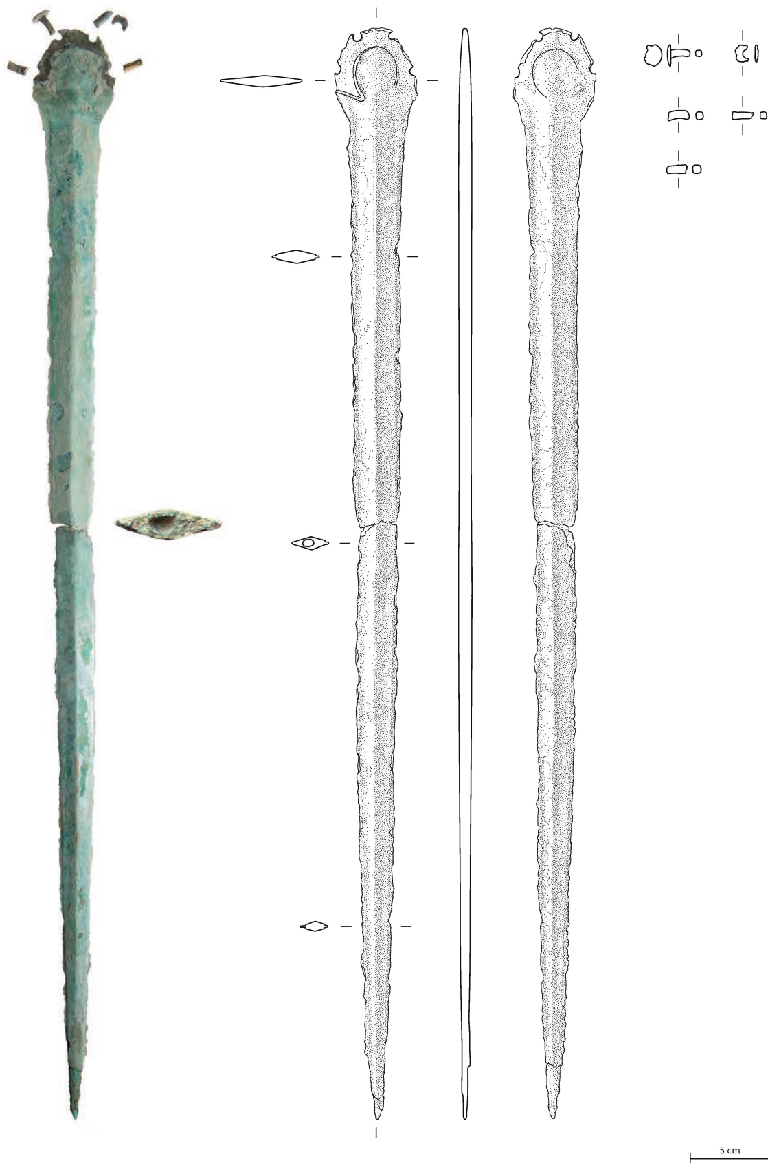
Abb. 3. Eschenz-Hörnliwald TG. Das im Bereich eines Gusslunkers in zwei Teile zerbrochene Bronzeschwert mit Ring- und Pflocknieten. Der Ansatz des organischen Griffs zeichnet sich über die unterschiedliche Patinierung ab. Detail Gusslunker nicht massstäblich. Foto AATG, J. Rüthi und U. Leuzinger, Zeichnung J. Näf.