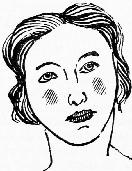
Linie als Farbe

Eine chinesische Anekdote erzählt: Der Kaiser hatte einen Maler auf Studienreisen geschickt. Als sich der Künstler nach Jahren wieder zurückmeldete, fragte ihn der Kaiser, was er gelernt habe. Ohne zu antworten, ergriff der Maler einen Pinsel und zeichnete mit wenigen, sichern Strichen einen Hahn. Der Kaiser war entzückt. Auf seine Frage, ob das alles sei, was er gelernt habe, nickte der Maler und führte ihn vor einen Kasten, der Berge von Skizzen enthielt — alle dieses selben Hahnes.