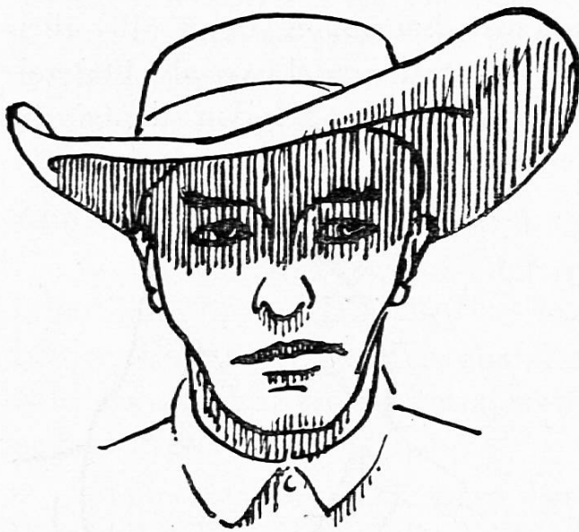
Linie als Schatten

Auch die Tatsache, dass zwei Bilder verschiedener Maler, die das gleiche Motiv darstellen, gewisse Unterschiede aufweisen, deutet darauf hin, dass der Künstler das, was für ihn wichtig ist, auswählt und in seiner Darstellung betont. Zu viele Einzelheiten würden vom Kern der Darstellung ablenken. Es ist gar nicht so einfach, mit wenigen Strichen viel zu sagen.