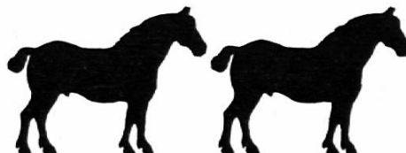
d i e P f e r d e