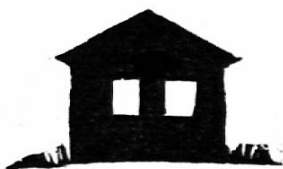
d e r S t a l l