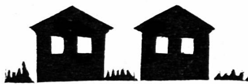
d i e S t ä l l e