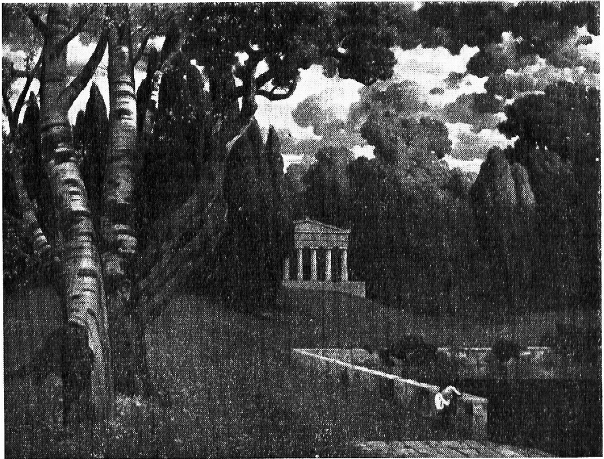
Eduard Rüdisühli Am heiligen Wasser

Der Maler begnügt sich nicht mit einer schlichten Landschaftsdarstellung. Weil es ihm nicht gelingt durch formale Gestaltung das Motiv aus dem Alltäglichen herauszuheben, versucht er den deutschen Buchenhain mit Zypressen und griechischen Tempeln interessant zu machen. Durch Regeln kann man nicht echte und verlogene Romantik unterscheiden lernen, wohl aber durch intensive Betrachtung von Kunstwerken. Wie lebendig wirkt das knorrige der Baumstämme und das Büschelige der Laubkronen bei der Radierung von Rembrandt. Wie schematisch und wattig wirken die Bäume dagegen hier.