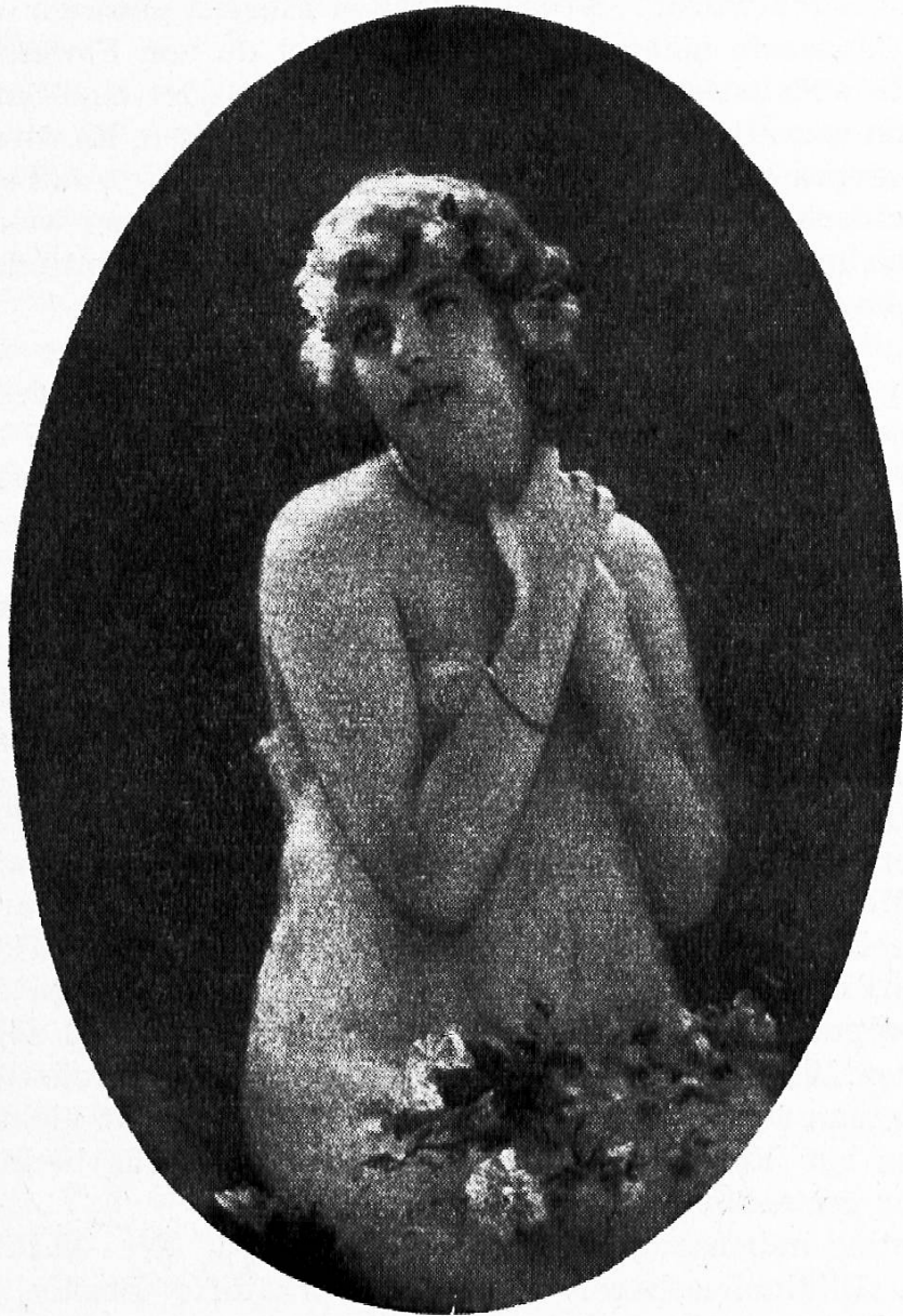
Serendat de Belzim Veille de nocces

Die Stellung der Figur ist ähnlich wie bei der Blumenbinderin von Hodler. Der halbgeöffnete Mund und der Augenaufschlag zeigen das Weichliche und Süßliche der ganzen Darstellung besonders deutlich. Man vergleiche mit diesem leeren Gesicht das herbe, klargeformte Gesicht der Blumenbinderin. Von formaler Gestaltung des Motivs ist nichts zu spüren. Kitschbilder dieser Art wirken wegen ihrem äußerlichen Naturalismus besonders peinlich.