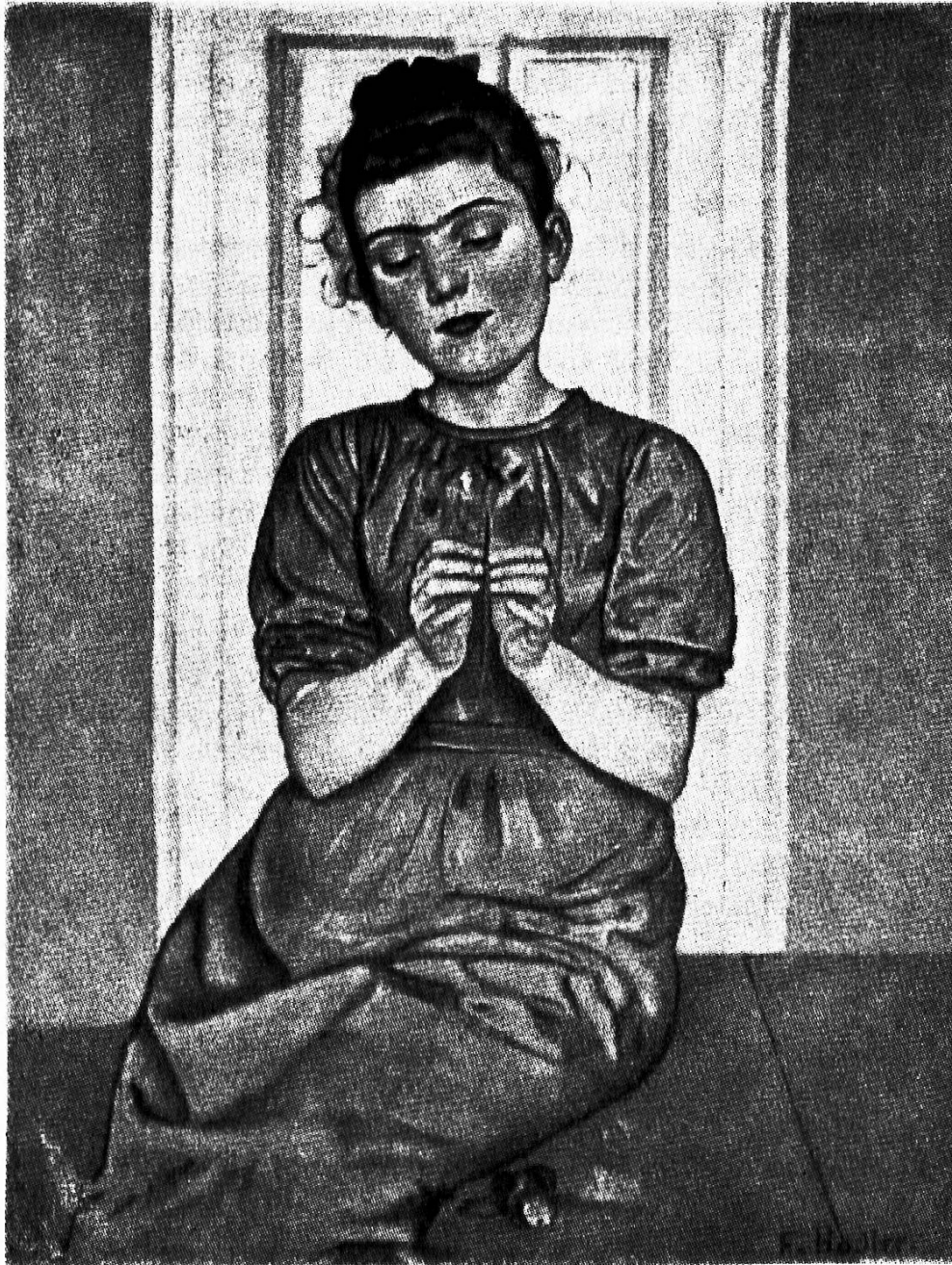
Ferdinand Hodler Die Blumenbinderin 1890

Auf den ersten Blick wirkt die Blumenbinderin weniger natürlich als das Kitschbild. Im strengeren Aufbau spürt man den Gestaltungswillen des Künstlers. Die Gestalt des Mädchens hebt sich klar von der hellen Zimmertür ab. Auffallend ist die strenge Symetrie in der Gestaltung der Arme und Hände. Die runden Formen des Körpers sind den geraden der Türe gegenübergestellt. Die graue Fläche des Kleides ist durch Falten lebendig gegliedert. Diese Gliederung wird noch stärker zur Wirkung gebracht durch den ruhigen Hintergrund