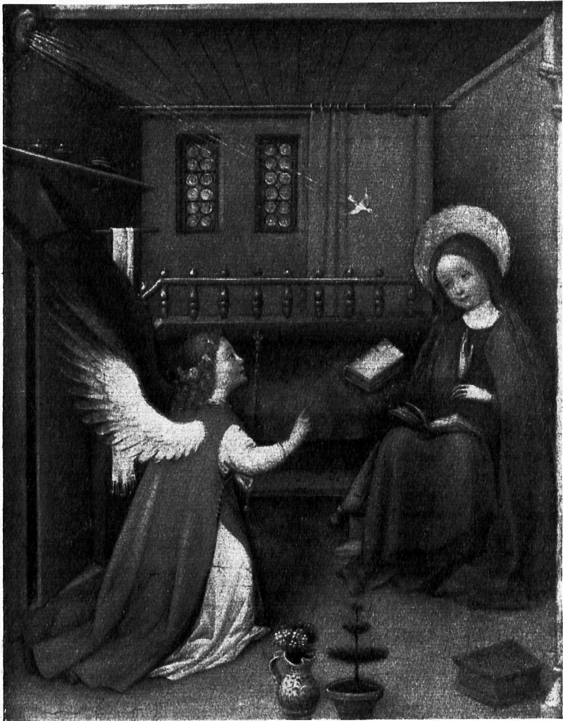
Oberrheinischer Meister um 1420 Die Verkündigung an Maria (Sammlung Dr. Oskar Reinhart, Winterthur)

Der Maler dieses kleinen Holztafelbildes stammt aus der Gegend zwischen Basel und Straßburg. Mit fast kindischer Naivität schildert er die Verkündigung. Wenige leuchtende Farben, blau, rot und grün sind in die braunen Töne des Raumes eingebettet. Der Engel sucht Maria in ihrem Zimmer auf. Das Zimmer ist mit derselben Naivität gestaltet wie die Figuren. Es wirkt eher wie eine Raumnische, weil der Maler die perspektivischen Gesetze noch nicht kennt. Ganz unbekümmert um die perspektivische Erscheinung stellt er das Kästchen im Vordergrund oder das Buch auf der Bank dar