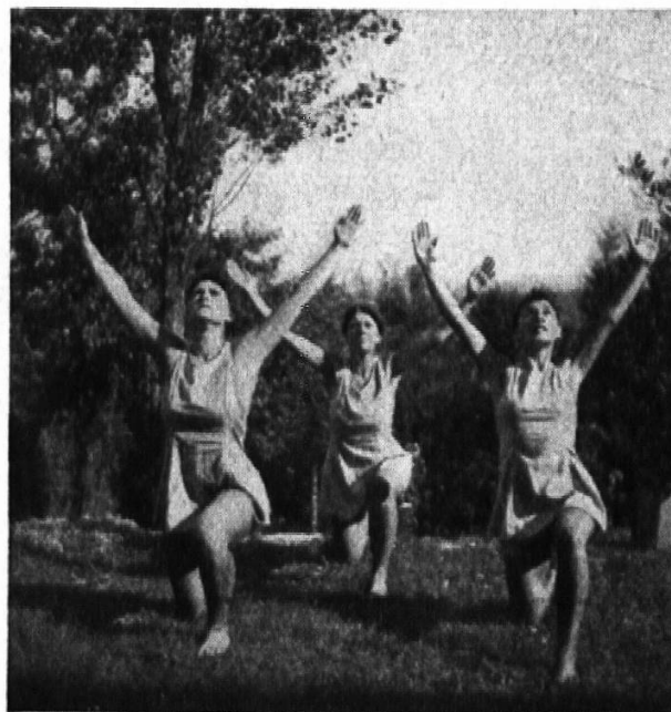
Arbeit in der Gemeinschaft

Die Schule darf nun der Verpflichtung, den Mädchen auf körper-erzieherischem Gebiet zu seinem Recht zu verhelfen, nicht entbunden werden. Die Aufgabe wird heute aber noch ungenügend gelöst, leider begnügte sich die Erziehungsdirektoren-Konferenz im Jahre 1940, bei der Behandlung der Mädcheturnfrage, mit einer entsprechenden Empfehlung an die kantonalen Erziehungsdepartemente. Sie tat es in der Annahme, eine sehr große Mehrheit aller Mädchen erhalte Turnunterricht. Die Erhebungen der «Körpererziehung» stellten daraufhin mit aller Deutlichkeit fest und private Informationen bestätigten es für unsern Kanton