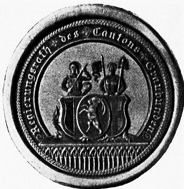
Siegel des Regierungsrates nach 1803