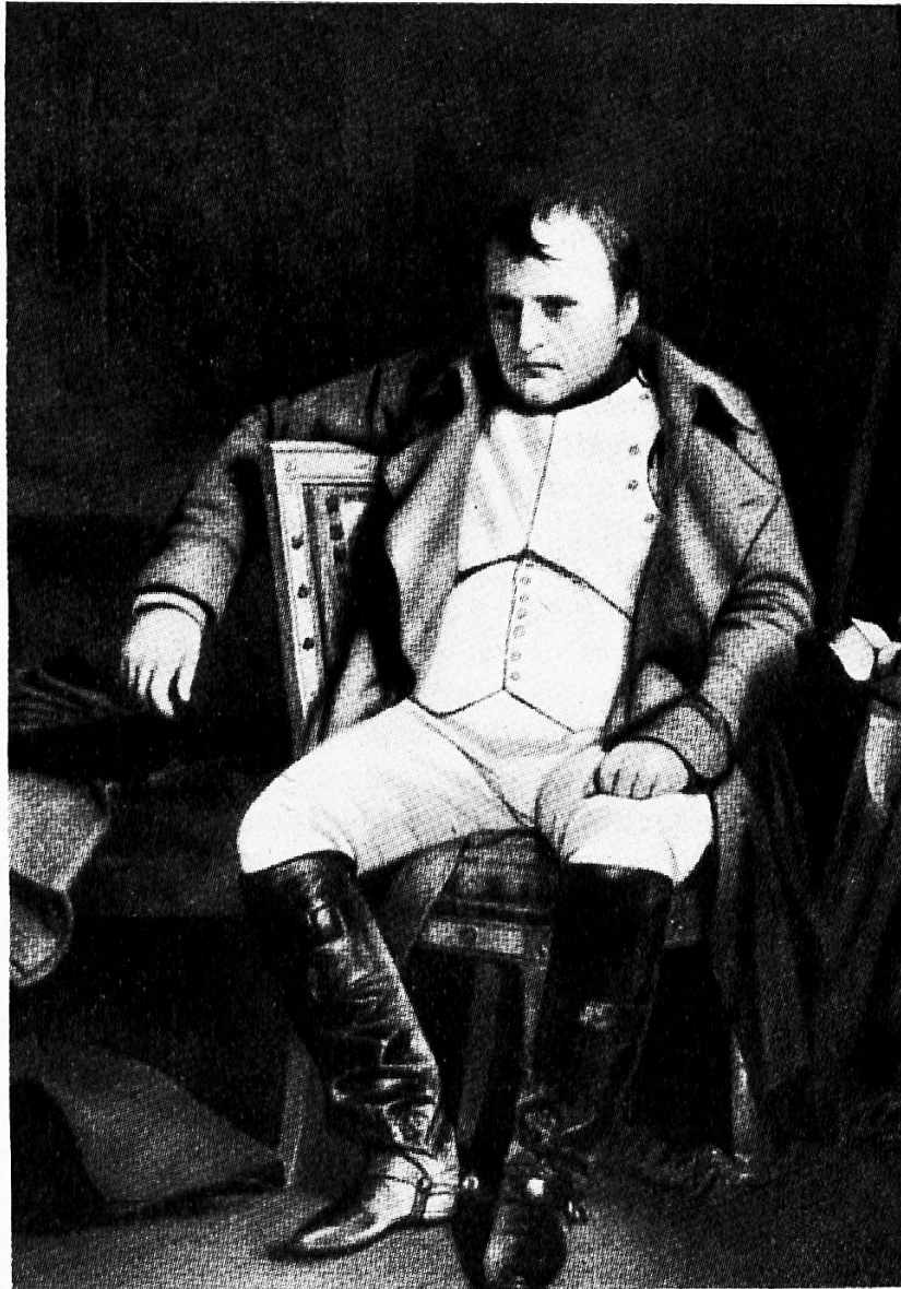
Napoleon in Fontainebleau, 1814

Blick zurückwerfen auf das, was unser Vaterland einst war, und dann betrachten, was es jetzt ist... Wie durch ein Wunder haben wir unsere Existenz behalten... Wie ein entmastetes Schiff, das endlich nach langen Stürmen einen Hafen erreicht, sind wir dem Untergang entronnen.»