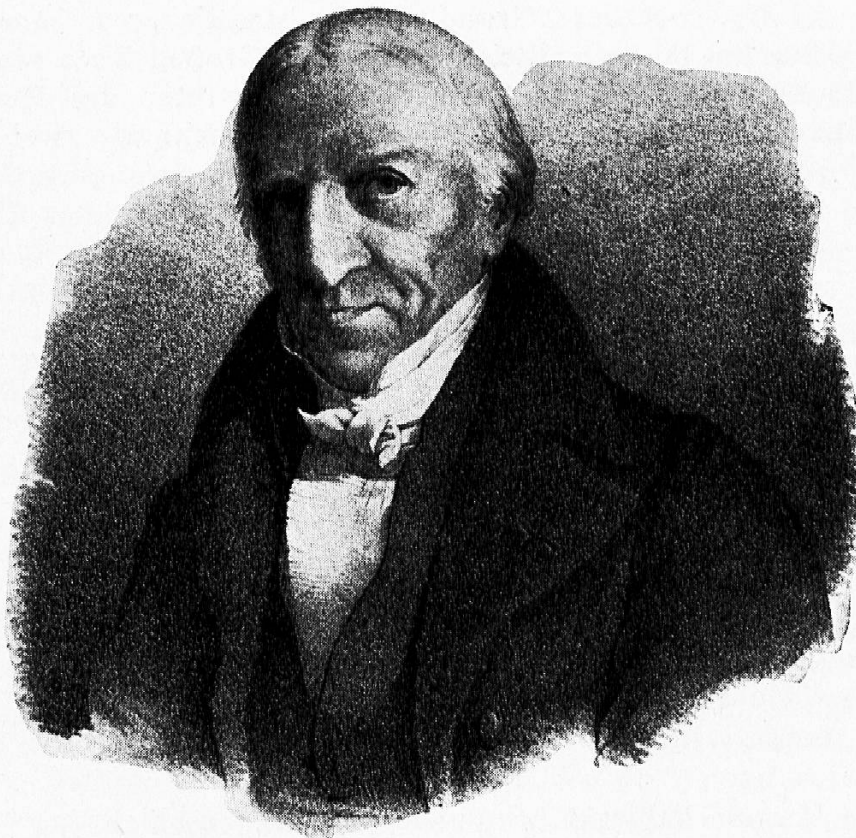
Joh. Gaudenz v. Salis-Seewis