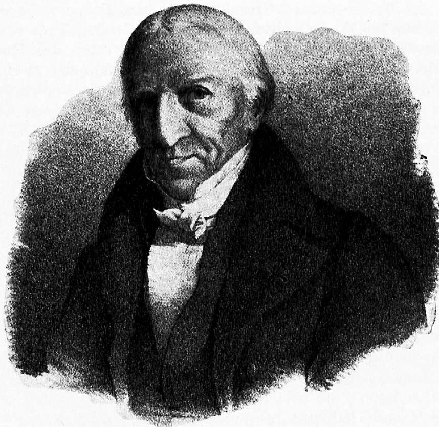
Joh. Gaudenz v. Salis-Seewis