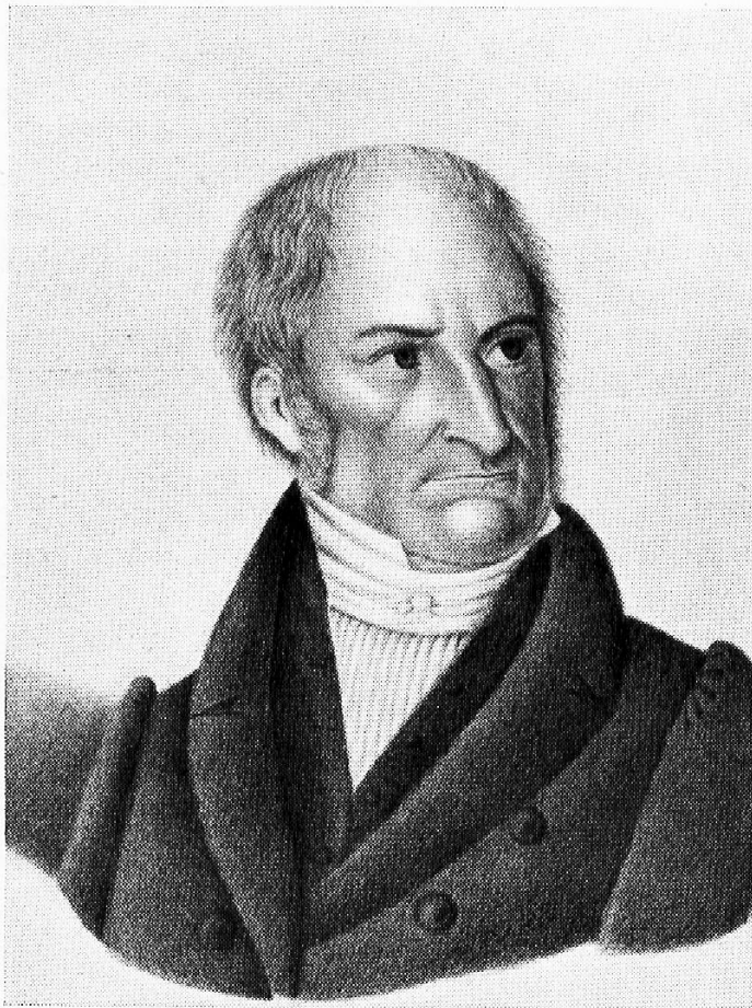
Jakob Ulrich Sprecher von Bernegg

Ich schliesse mit dem Wunsche, welchen die Regierungskommission mit dem meinigen vereint, daß der Geist der Einigkeit Sie beseelen, und keine andere Rücksicht als das Wohl des Vaterlandes Ihre Verhandlungen leiten wolle; dann wird der Himmel Ihre Verrichtungen und Ihre Zeitgenossen, so wie Ihre Nachkommen die erste Versammlung des Großen Raths segnen; das Bewußtseyn Ihre Pflicht gethan zu haben, wird einst vor dem ewigen Richter, dem wir alle Rechenschaft schuldig sind, Ihre Seele verklären, und Ihre Namen den Herzen aller Freunde des Vaterlandes theuer bleiben.