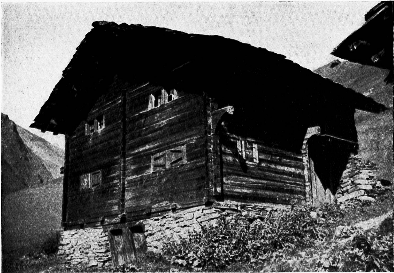
Abb. 26. Altes Doppelhaus in Vrin, Puzatsch.

Initialen und Verzierungen an Pfettenköpfen zu ermitteln und zu photographieren, halfen die Leute tüchtig mit.