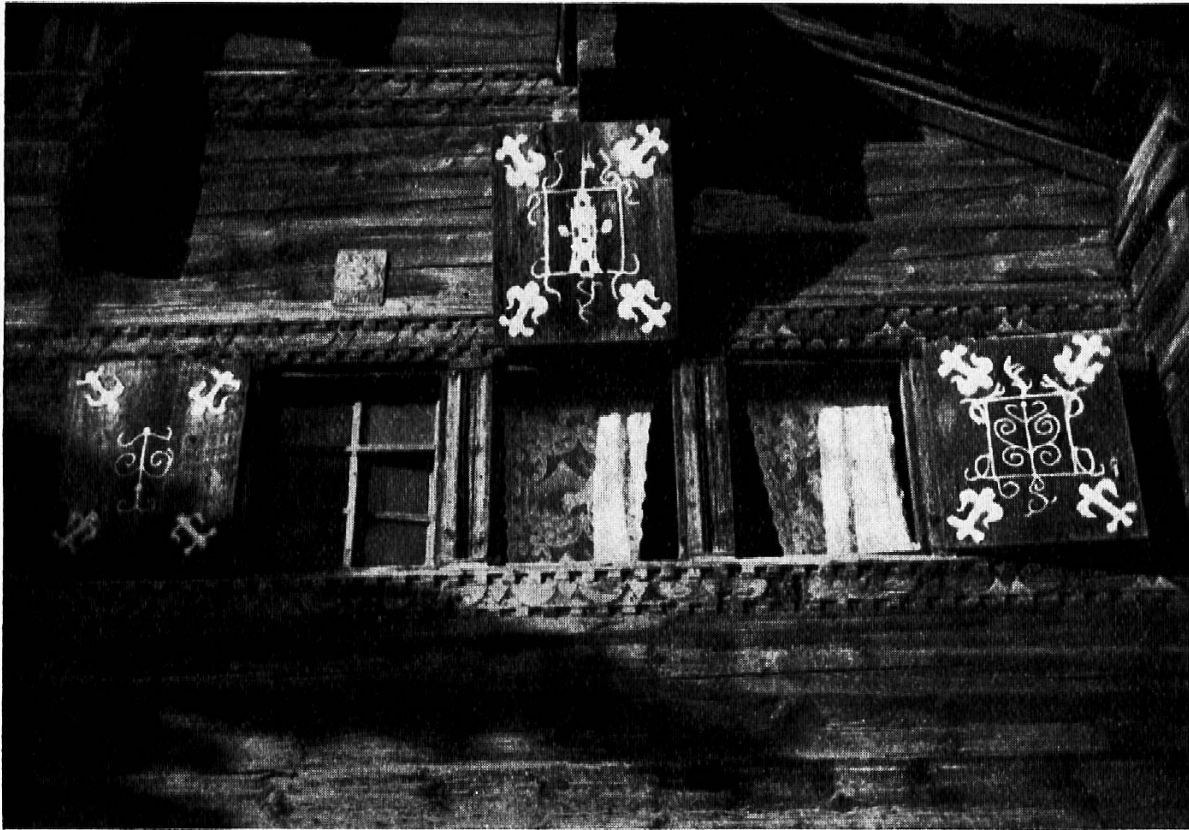
Abb. 28. «Vrinerhaus»

nezertales sind besonders reich an baulichen Eigentümlichkeiten, so besonders Vrin, Lumbrein und Villa. Solche Orte beanspruchten mehrere Tage, bis die Arbeit einigermaßen erledigt war. Mit etwa 1200 Photographien und zahlreichen Skizzen beendete ich meine Aufnahmen in der Surselva. Das Material mußte noch gesichtet und die Bilder mußten beschriftet werden. Daß aus den 30 Tagen 100 wurden, ist wohl leicht verständlich.