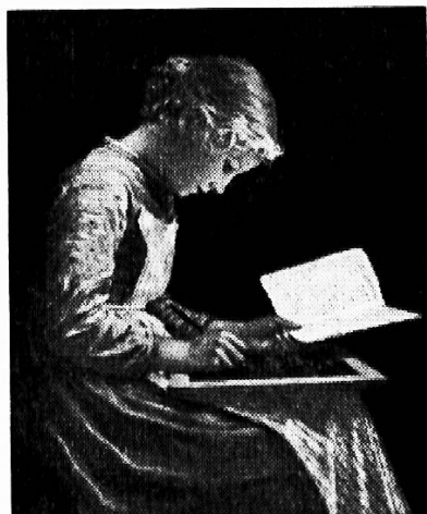
Anker: Die schreibende Schülerin

Die Zeiten ändern — eines ist sich aber gleich geblieben, Auf Schiefertafeln wird auch heute noch geschrieben!