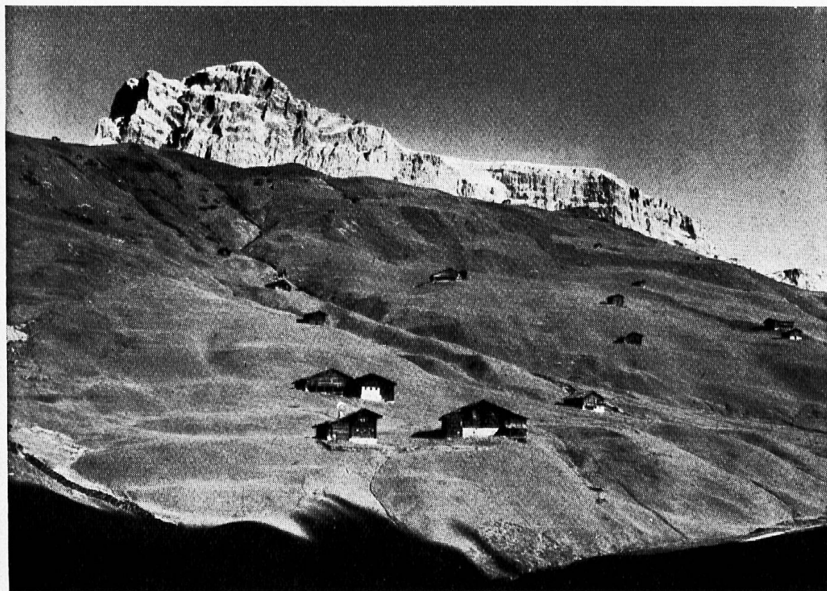
St. Antönien (Prätigau)

terrichtsstunde im Schulraum. Der Lehrer darf der Kritik, die hier gelegentlich am falschen Ort einsetzt, mit gutem Gewissen erwidern, daß er sich auf diese Weise durchaus nicht etwa Erleichterungen verschafft, wie man ihm nicht ungerne vorwirft. Auch der Gewinn des Schülers soll nicht etwa kleiner sein. Dabei denke ich nicht nur an den Ertrag an erzieherischen und kenntnismäßigen Werten; es wäre auch ein unbestreitbarer Erfolg, wenn auf diese Weise die Freude und der Genuß an einer Fußwanderung geweckt und gefördert würden. Und das scheint mir ein Weg zu sein, durch den das Kind sehen lernt, wieviel an Schönerm einem auch auf einer kleinen Wanderung, sofern die Augen dafür geöffnet sind, entgegentritt und wieviel des Interessanten man erleben und erwandern kann, wenn man nicht achtlos und blasiert an allem vorbeirent.