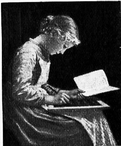
Anker: Die schreibende Schülerin

Die Zeiten ändern — eines ist sich aber gleich geblieben, Auf Schiefertafeln wird auch heute noch geschrieben!