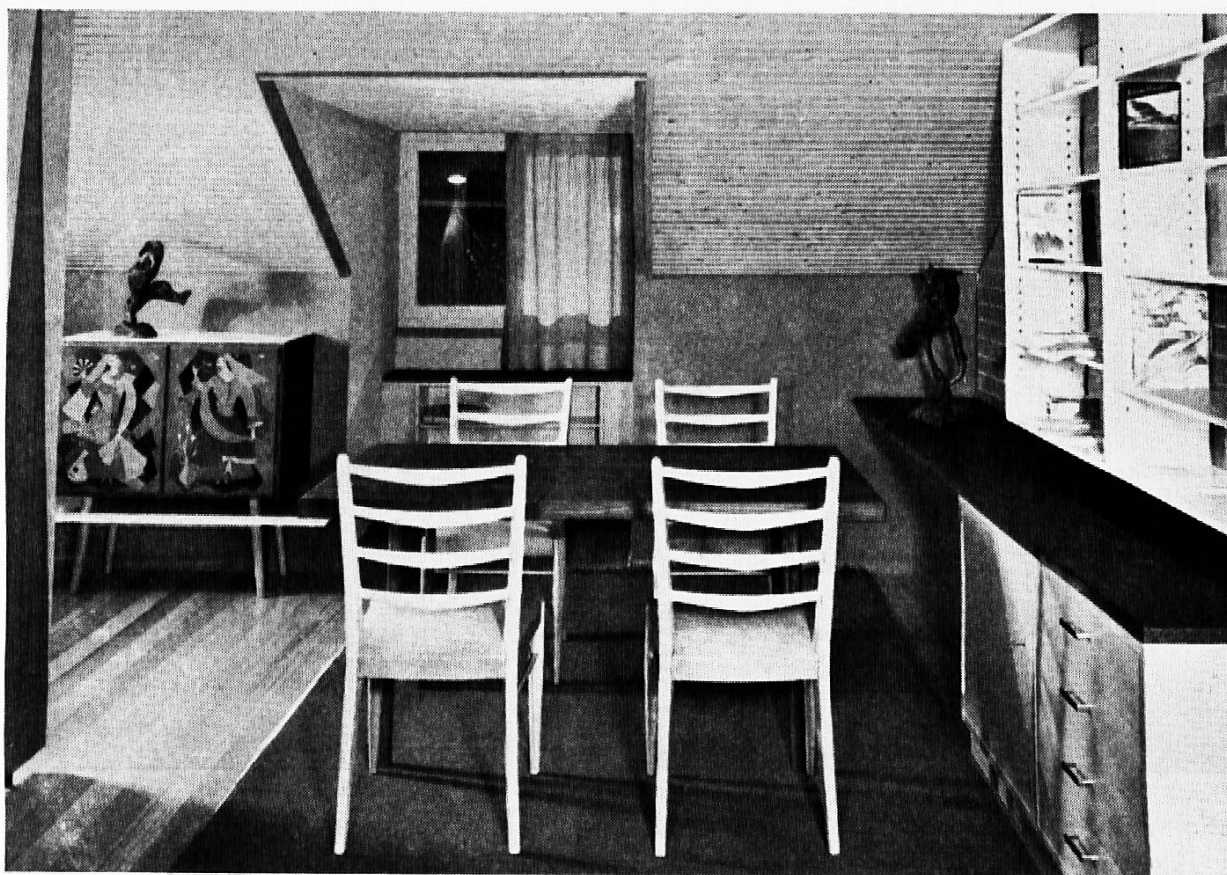
Ausgebauter Dachraum, mit astigem Leistentäfer aus Tannenholz verkleidet. Aus der Holzmesse Basel 1959.

Weshalb fühlen wir uns in einem Raum umso wohler, je vollständiger er mit Holz ausgebaut ist? Ausgedehnte Wärmemessungen und raumklimatische Untersuchungen in Versuchshäusern durch die Eidgenössische Materialprüfungsanstalt haben wertvolle Aufschlüsse gebracht. Es sind viele Faktoren im Spiel. Besonders wichtig ist der Umstand, daß der Mensch mehr als die Hälfte seiner überschüssigen Wärme durch Strahlung an die ihn umgebenden Flächen und Gegenstände abgibt. Haben diese eine hohe Oberflächentemperatur wie beim Holz, so ist die Abstrahlung und damit der Wärmeverlust geringer und das «Behaglichkeitsgefühl» wird gesteigert. Dazu trägt bei, daß Innenflächen aus Holz relativ niedrige Luftfeuchtigkeiten ergeben, sie «atmen» überschüssige Feuchtigkeit ein; das Raumklima, wird günstig beeinflußt: im Winter warm, im Sommer die Schweißverdunstung erleichternd. Doch alles, was die wissenschaftliche Wohnphysiologie herausfindet, sagen eigentlich dem Menschen seit je seine eigenen Organe; sie registrieren aufs feinste, ob es ihm in einem Raum wohl ist oder nicht. Und im holzumschlossenen Raum ist es ihm wohl!