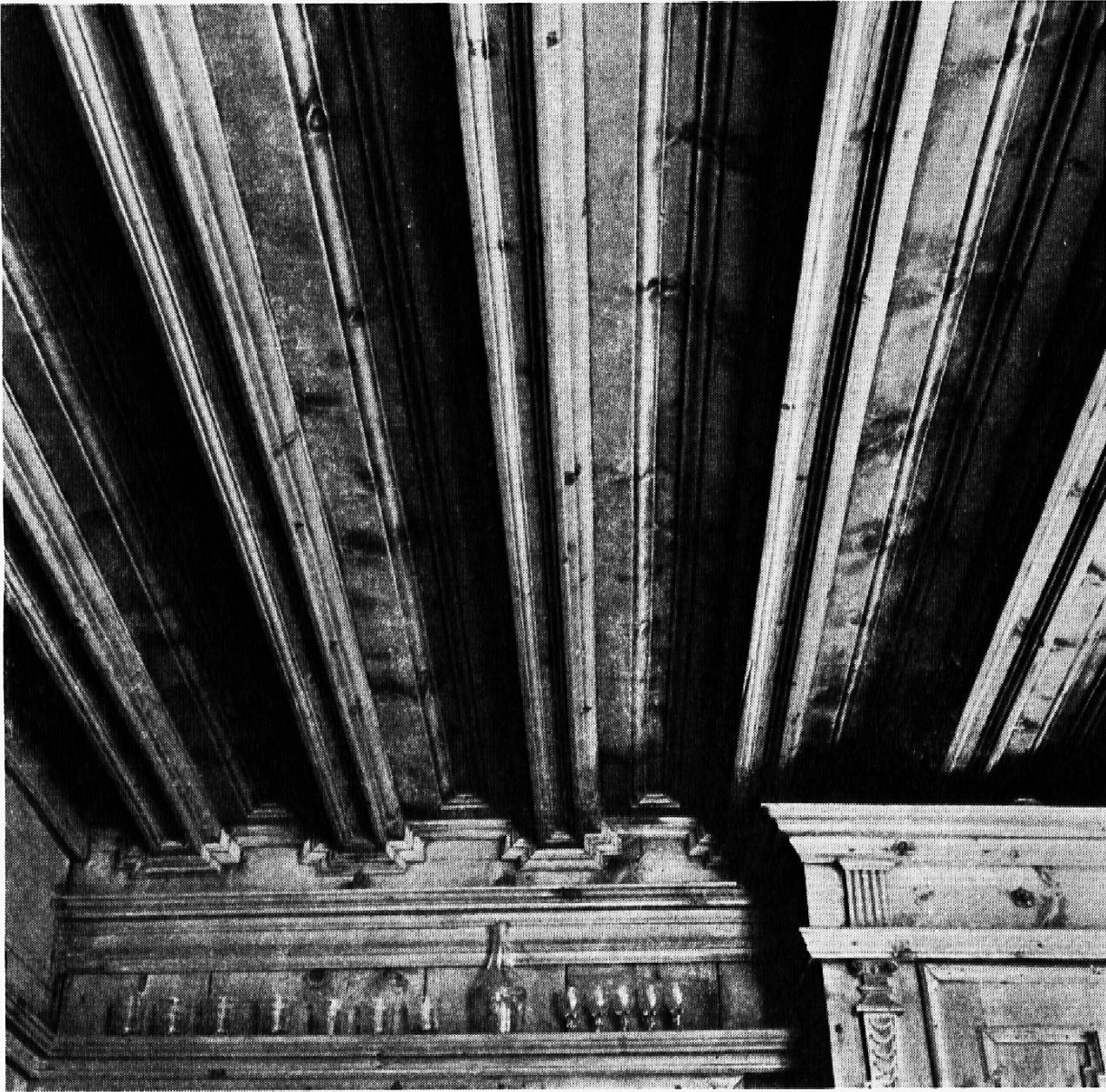
Balkendecke im Engadinermuseum. Die Gliederung der profilierten Balken mit den Zwischenfeldern ist zugleich konstruktiv und schön.

Im Engadin und den benachbarten Tälern haben wir ursprünglich ebenfalls den gemischten Stein-Holz-Blockbau des Gotthardhauses, bis dann vom 17. Jahrhundert an die Häuser mit einem dicken Steinmantel umgeben wurden, der mit seinen tiefen Fensternischen, den schönen Erkern und dem reichen Sgraffito-Putz so reizvoll und charakteristisch für das Bündnerhaus ist. Es ist offensichtlich inspiriert von der Renaissance-Architektur Italiens, aber die Bündner machten etwas ganz Eigenes und Einzigartiges daraus.