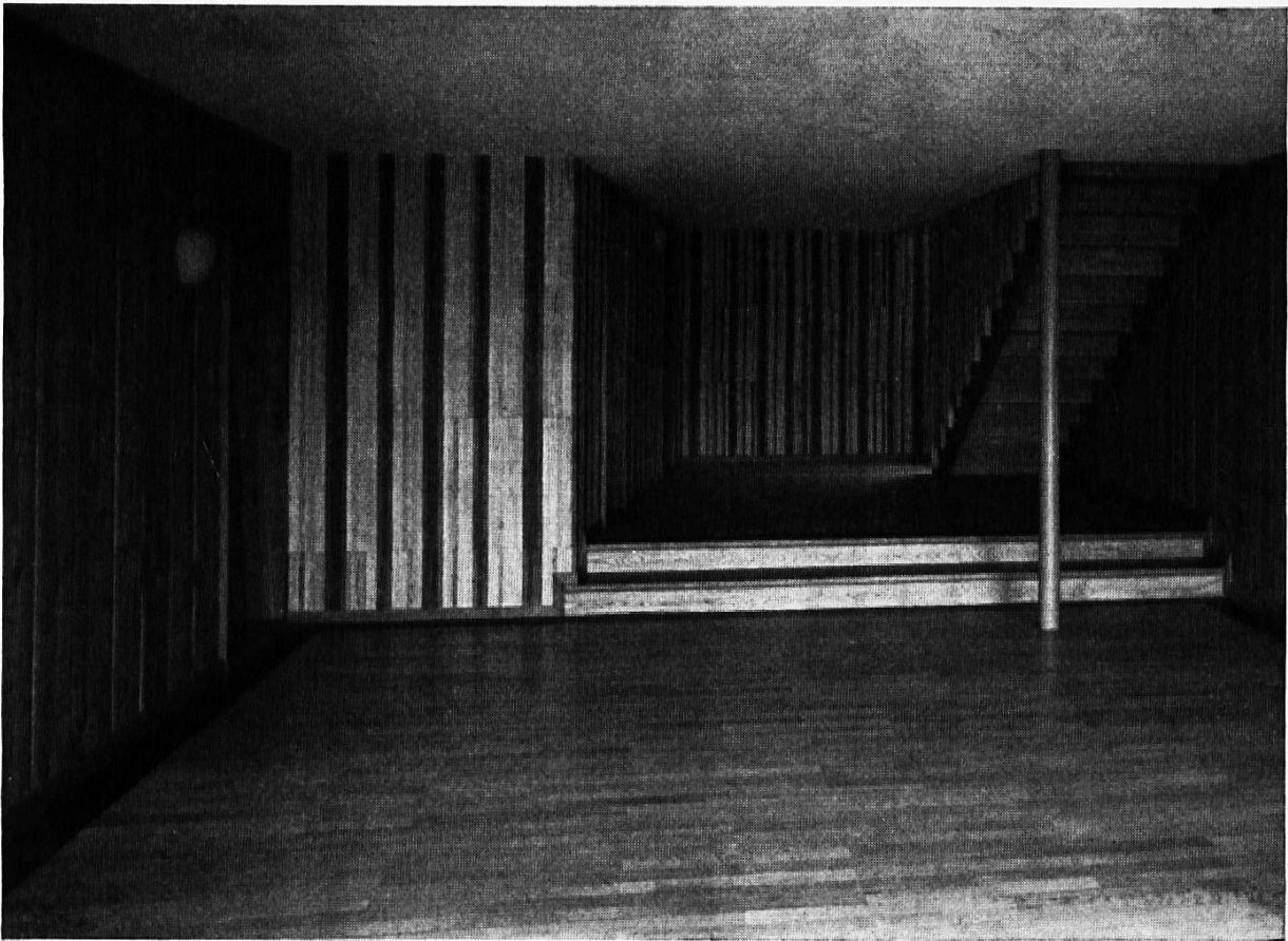
Treppenhalle in der Forstwirtschaftlichen Zentralstelle in Solothurn. Seitenwände aus astigen Lärchenbrettern. Hinterwand aus unregelmäßigen Streifen verschiedener Hölzer. Arch. Steiger, St. Gallen, Innenarch. J. Müller, Zürich.

Fachwerkbau im Mittelland. Aber wir sehen auch, daß der Mensch den Werkstoff nach seinem Bedürfnis verwendet: Stein mehr für den Wirtschaftsteil des Hauses, Holz für den Wohnteil. Oder in Bünden: Stein für die Ummauerung, als Schutz gegen Wind und Wetter, Holz für die unmittelbare Umgebung, da, wo man wohnt.