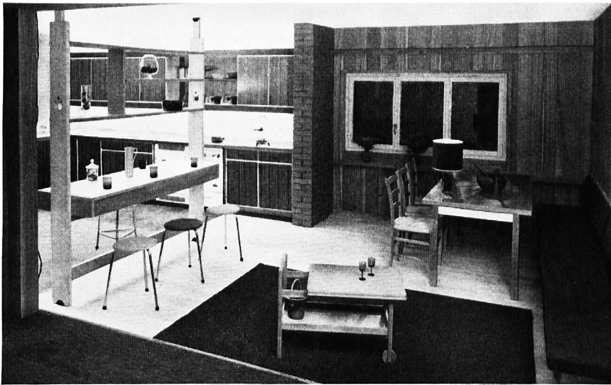
Wohnküche mit Frühstücksbar und Eßplatz. Aus der Holzmesse 1960, Basel.