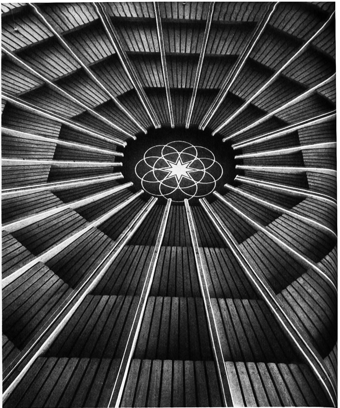
Kirchendecke in Zürich-Seebach. Schöne Betonung des zentralen Raumes durch das Wechselspiel der Balken und Bretter. Arch. A. H. Steiner, Stadtbaumeister, Zürich.