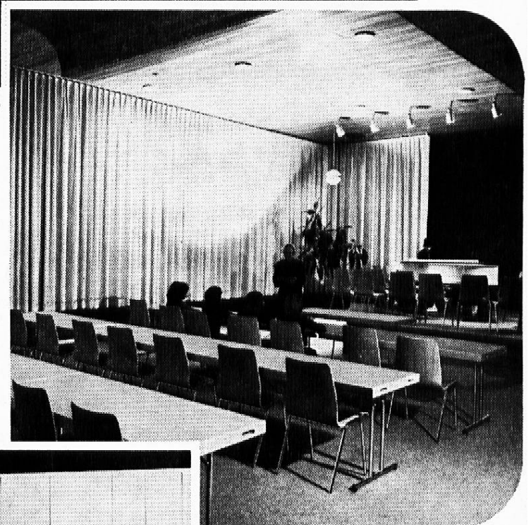
Saalmöbel für jeden Bedarf

Verlangen Sie unverbindlich Prospekte, Angebot und Möblierungsvorschläge.