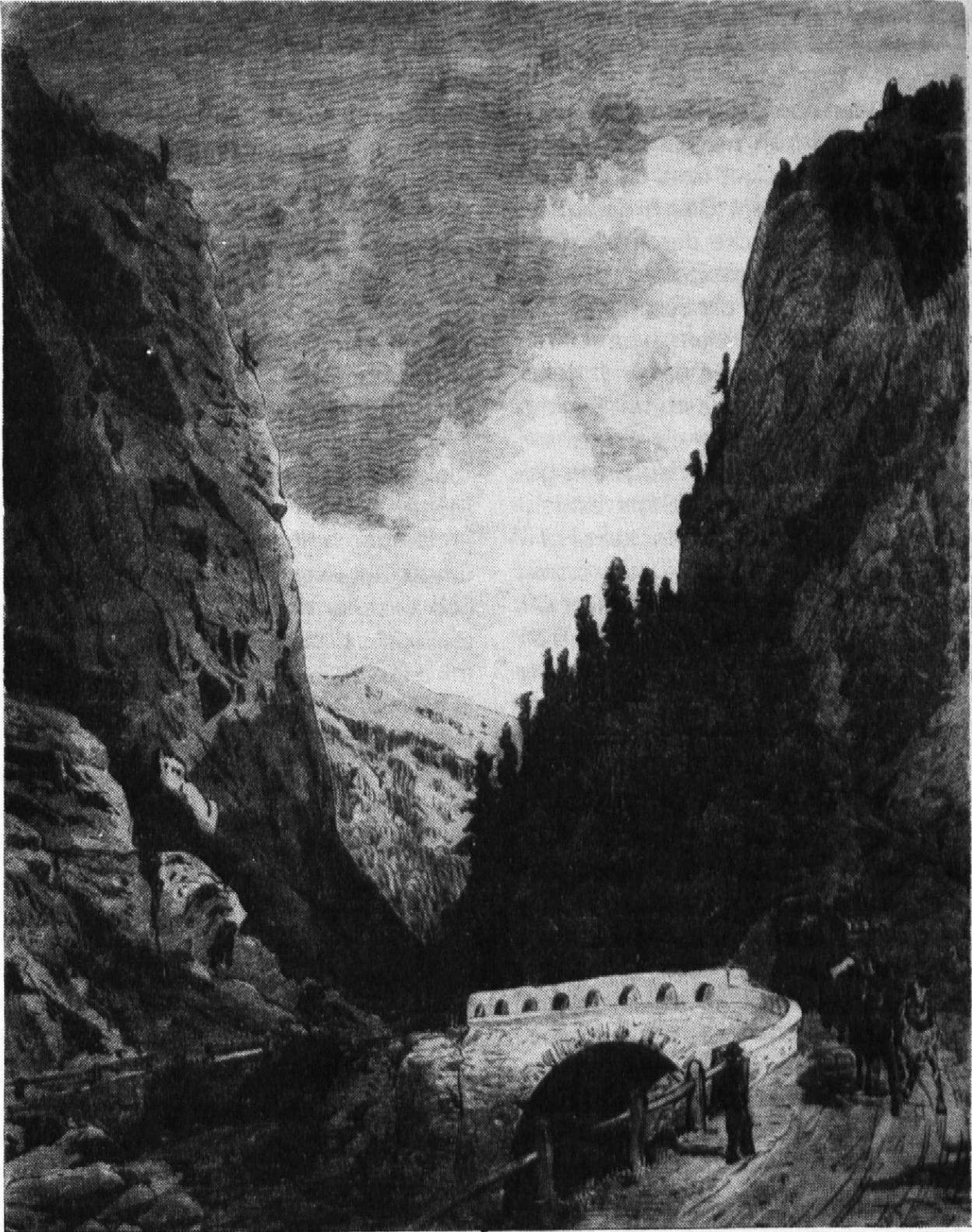
Die Schlossbrücke in der Klus