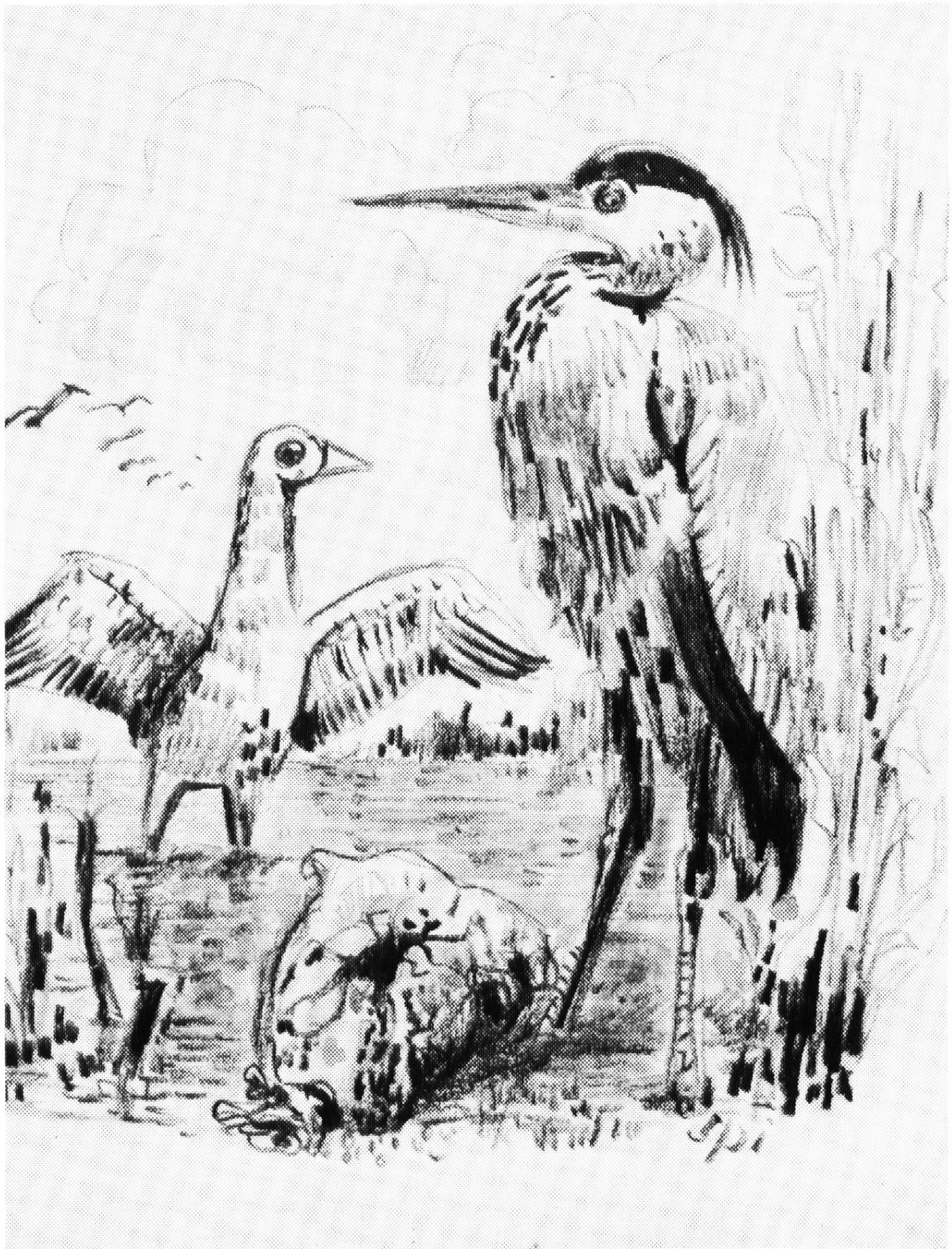
Der Reiher und die Gans