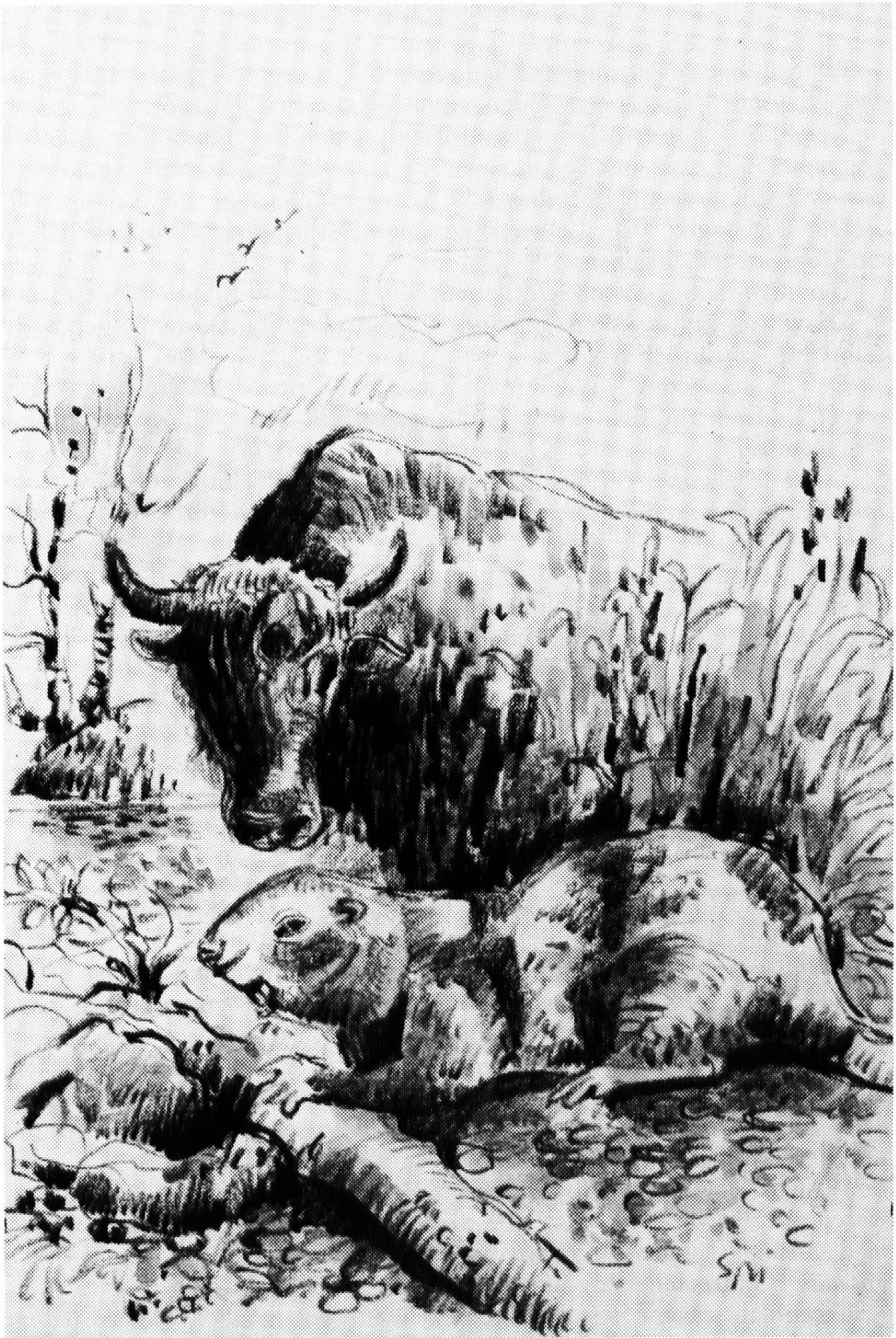
Ein Stier und ein Biber