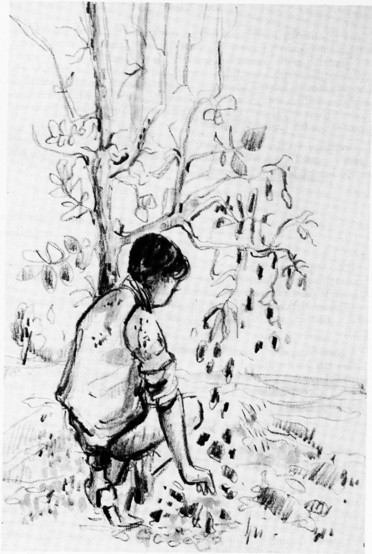
Das kranke Bäumchen