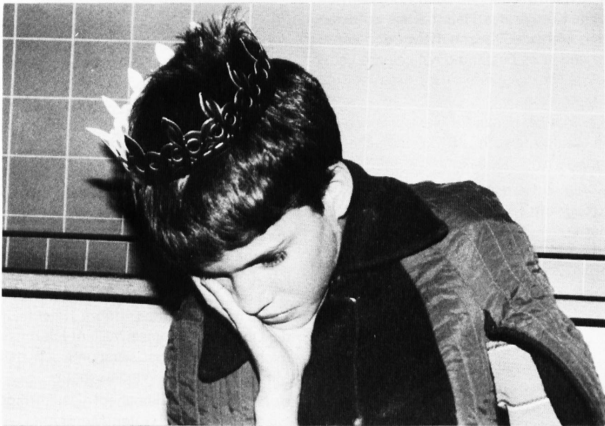
Der sorgengeplagte König

König: «Rufen Sie alle meine Räte zusammen!»