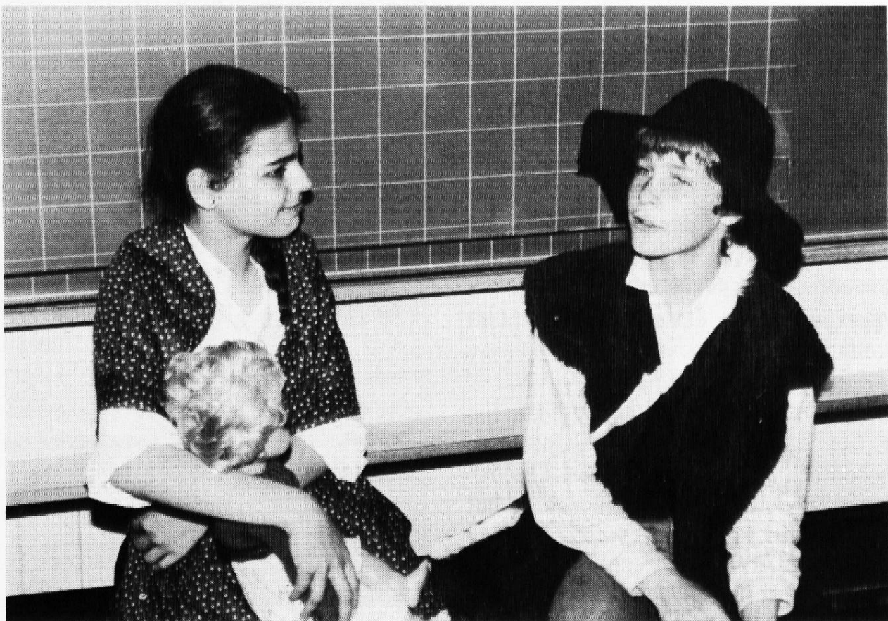
Die glückliche Hirtenfamilie