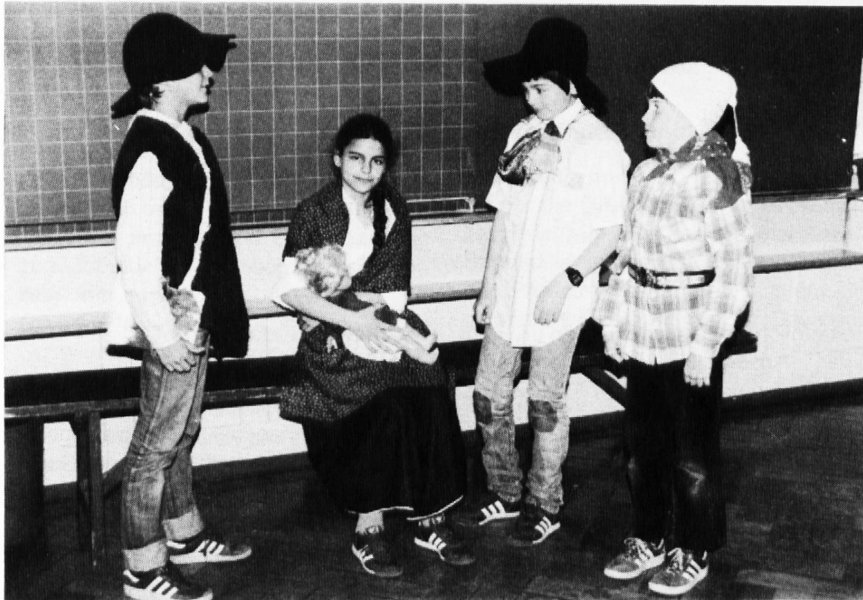
Die Boten des Königs kommen zur Familie des Schweinehirten

Herren, möchte zu Willen sein, so ist es mir doch nicht möglich, denn Zufriedenheit habe ich wohl, aber — kein Hemd am Leibe.»