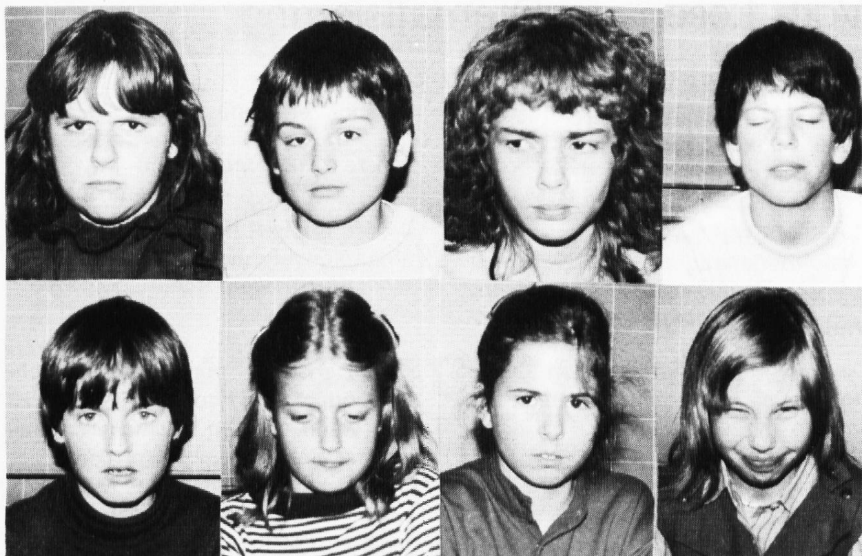
Die Schüler versuchen eine unzufriedene Miene zu machen. Dies gelingt nicht ohne weiteres.

Wilhelm Busch, Das Hemd des Zufriedenen (Lesebuch 5. Klasse, 1969 1 , Lehrmittelverlag des Kantons Zürich, S. 189 f.).