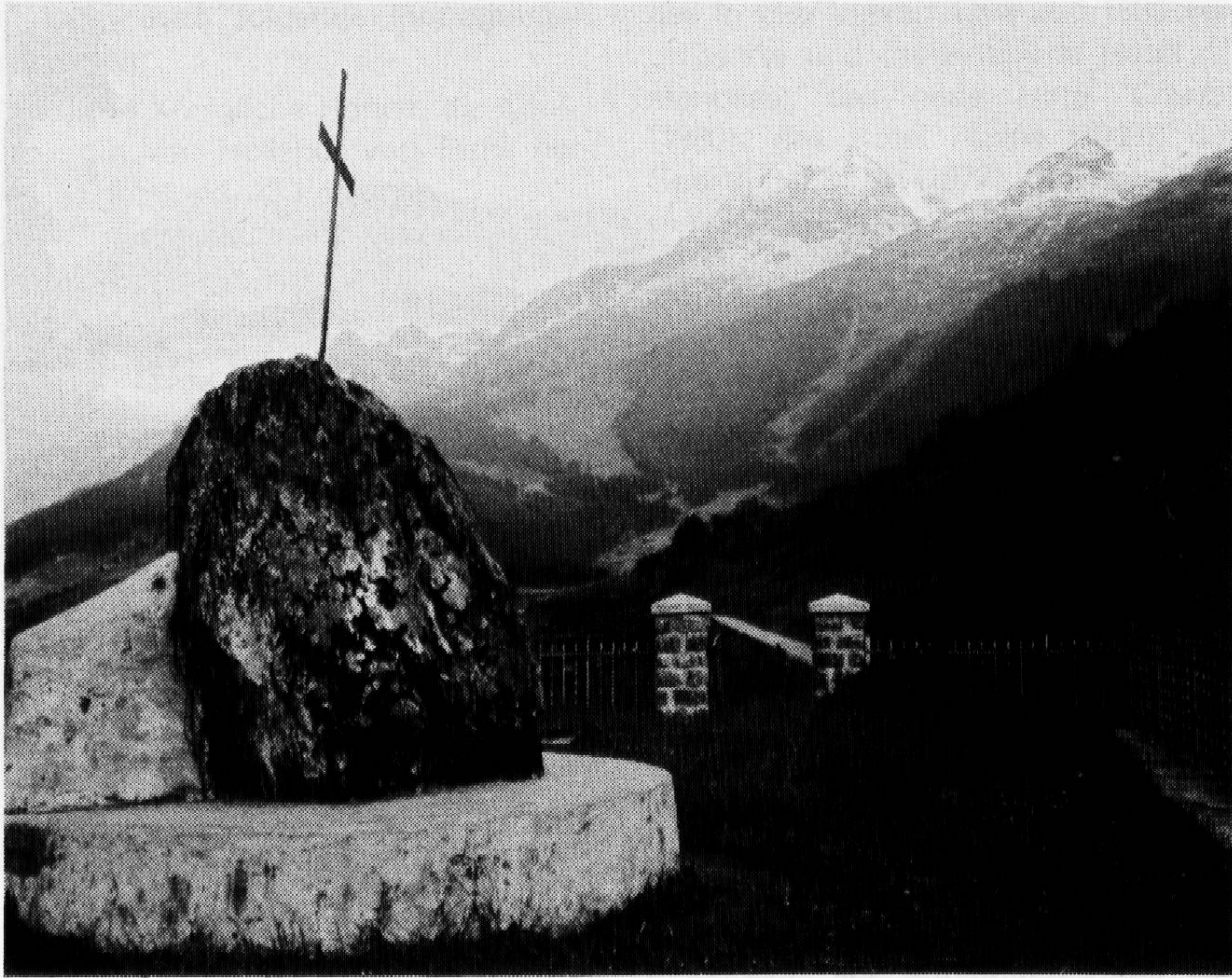
(Brigels-Waltensburg, Aussichtspunkt «Escherstein»)