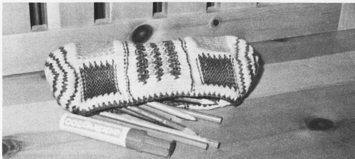
Etui, von M. Tönz

Im Namen der Inspektorinnenkonferenz: M. Tönz