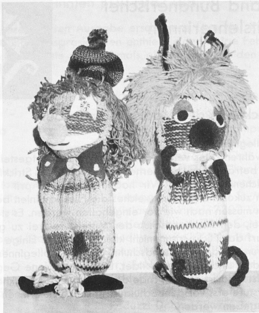
Clown und Biene Maya, von Elsbeth Knöpfel, Klosters