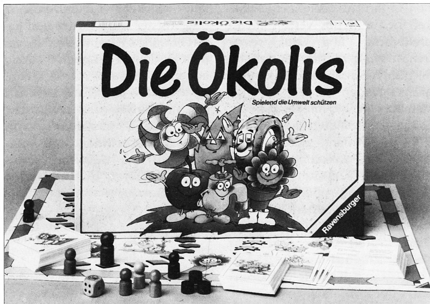
Das Spiel «Die Oekolis» vermittelt spielerisch und humorvoll erstaunliche Kenntnisse über die Zusammenhänge in der Natur. Noch bis September können Sie es gratis ausleihen.

Auskünfte und Bestellungen zum kostenlosen Probieren nimmt der Spieleverlag Carlit + Ravensburger, Telefon 056-740 140, unter dem Stichwort «Probieren für Schulen» gerne entgegen.