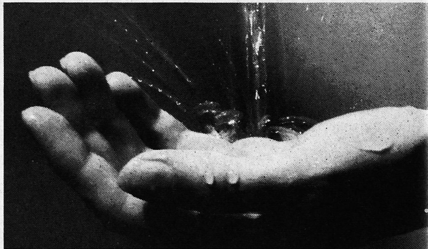
Hüb Sorg zum Wasser – Wasser isch Läbe.

Und dass wir alle Durst hätten nach der Wahrheit und nach Liebe, damit wir von Schuld reingewaschen werden könnten.