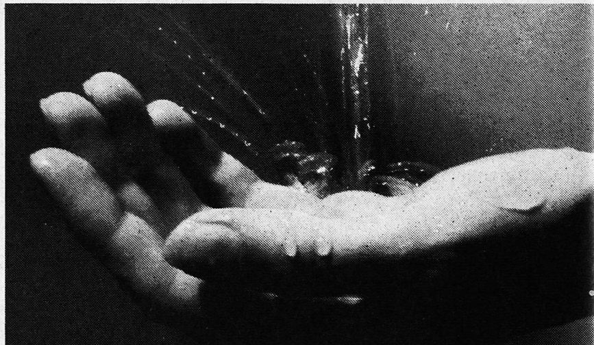
Hüb Sorg zum Wasser – Wasser isch Läbe.

Und dass wir alle Durst hätten nach der Wahrheit und nach Liebe, damit wir von Schuld reingewaschen werden könnten.