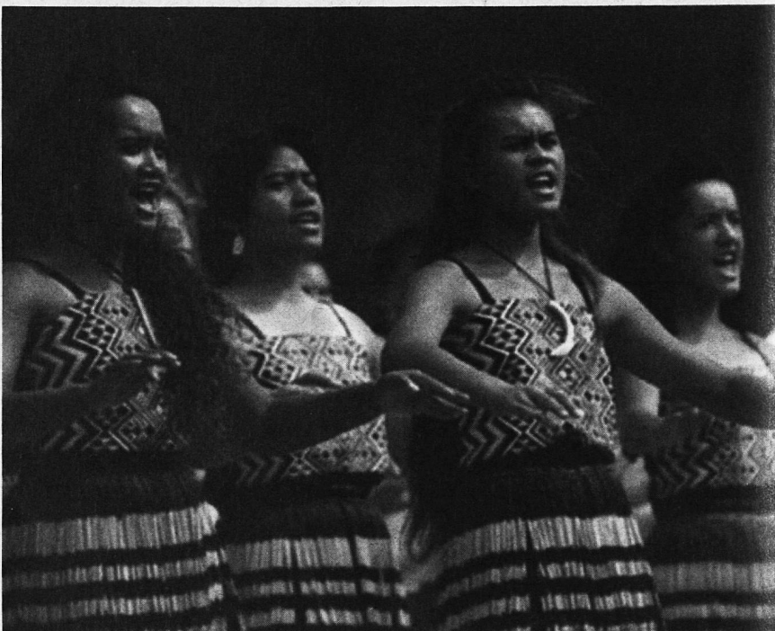
Junge Maori Frauen singen ein waiata ringa, «Lied mit beschreibender Gestik».

Mein Sohn, wie auch viele seiner Zeitgenossen, konnte zum Beispiel schon mit einem Jahr die «Kohanga Reo» besuchen. Somit konnte er schon vier Jahre in einer maorisprachigen Umgebung verbringen, bevor er mit fünf in eine maorisprachige Primarschule ging. Das Ziel dieser einsprachigen Lernbahn ist natürlich, dass die Kinder zweisprachig werden. Nach unserer Erfahrung führt die sogenannte zweisprachige Methode, wo beide Zielsprachen gleichwertig im Unterricht berücksichtigt werden, nicht zu diesem Resultat.