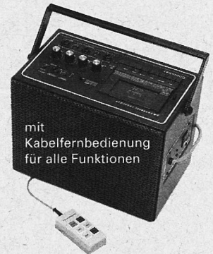
mit Kabelfernbedienung für alle Funktionen