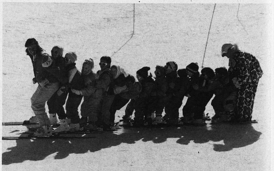
Einheimische – Gäste – Einheimische.

Einheimische und Touristen – da prallen Kulturen aufeinander, die Spannungen verursachen. Trotzdem soll das Leben miteinander möglich sein. Verständnis, Toleranz und Einfühlungsvermögen