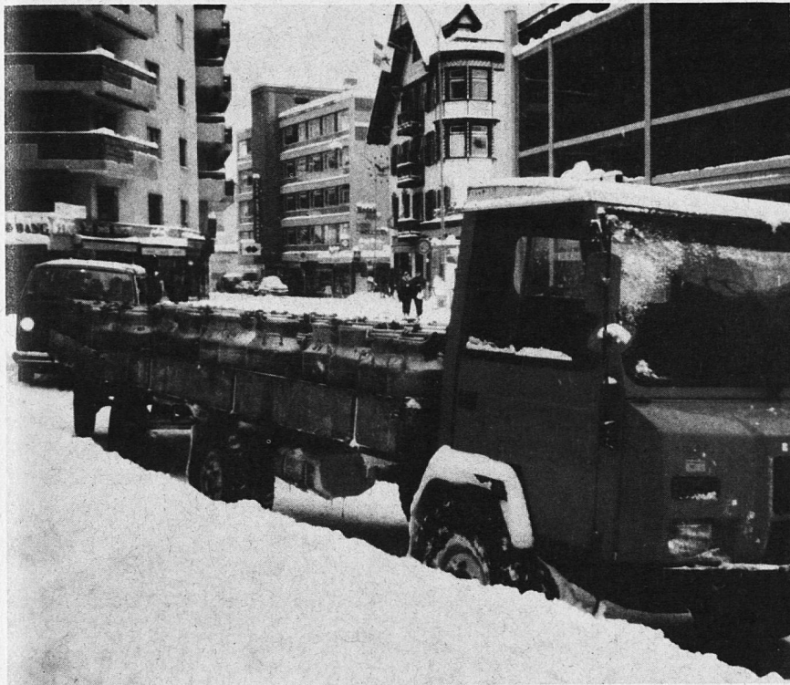
Landwirtschaft und Tourismus.