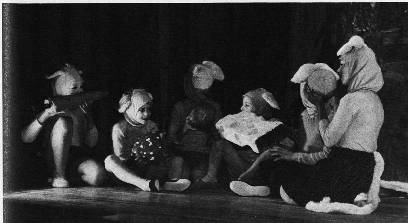
Mahl der Mäuse

Die Aufführung bildet natürlich den Höhepunkt des ganzen Schaffens. Dann ernten die Schüler, auch die schwächeren, gebührende Anerkennung. Viele Erwachsene schätzen die Gelegenheit, die Kinder einmal von einer anderen, positiven Seite kennenzulernen und erfreuen sich über die sichtbar gewordenen Leistungen. Dadurch gelingt es vielleicht auch, das Image der Schule ein wenig aufzupolieren.