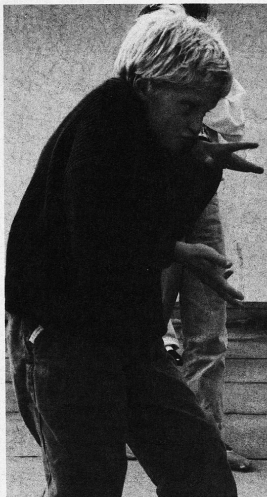
«Ich bin der freche Klapperstorch!»

Es geht nicht darum, gleich ein eigenes Theaterstück zu kreieren, oder Tanz und Theater als eigenes Schulfach zu propagieren. Vielmehr soll die Integration von Tanz und Theater in den Schulalltag eine Grundhaltung sein: Eine Grundhaltung, kreativ zu arbeiten, aus dem Innersten zu schöpfen, Individualismus zu fördern und das Kind statt den Stoff in den Mittelpunkt zu stellen. Vor allem aber