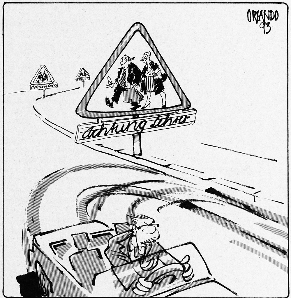
Aus BZ vom 17.7.93

Die wichtigste Grundlage zu diesem sogenannten neuen Lernen betrifft aber eigentlich eher eine Haltung als eine Methode. Die Lehrperson muss bereit und imstande sein, sich nicht an den Defekten, den Schwächen, Mängeln