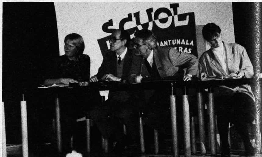
Die Lehrerinnen und Lehrer von Scuol führten ein elastisches Kabarett zum Abendthema «Alles ist dehnbar» auf und zeigten auch hier ihre Vielseitigkeit. Anschliessend spielten die Fräns Janett so mitreissend, dass auch nach Mitternacht niemand schlafen gehen wollte.

um 16.55 Uhr. Beim Aperitif im Bogn Engiadina, gestiftet von der Gemeinde Scuol, erholen sich die Delegierten von der DV und erhalten Einblick in die Geschichte des Bades.