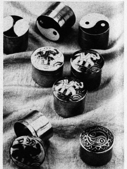
Schatzdöschen aus Indien

Die komplette Dokumentation zum Abzeichenverkauf können Sie telefonisch unter der Nummer 031/351 33 11 anfordern.