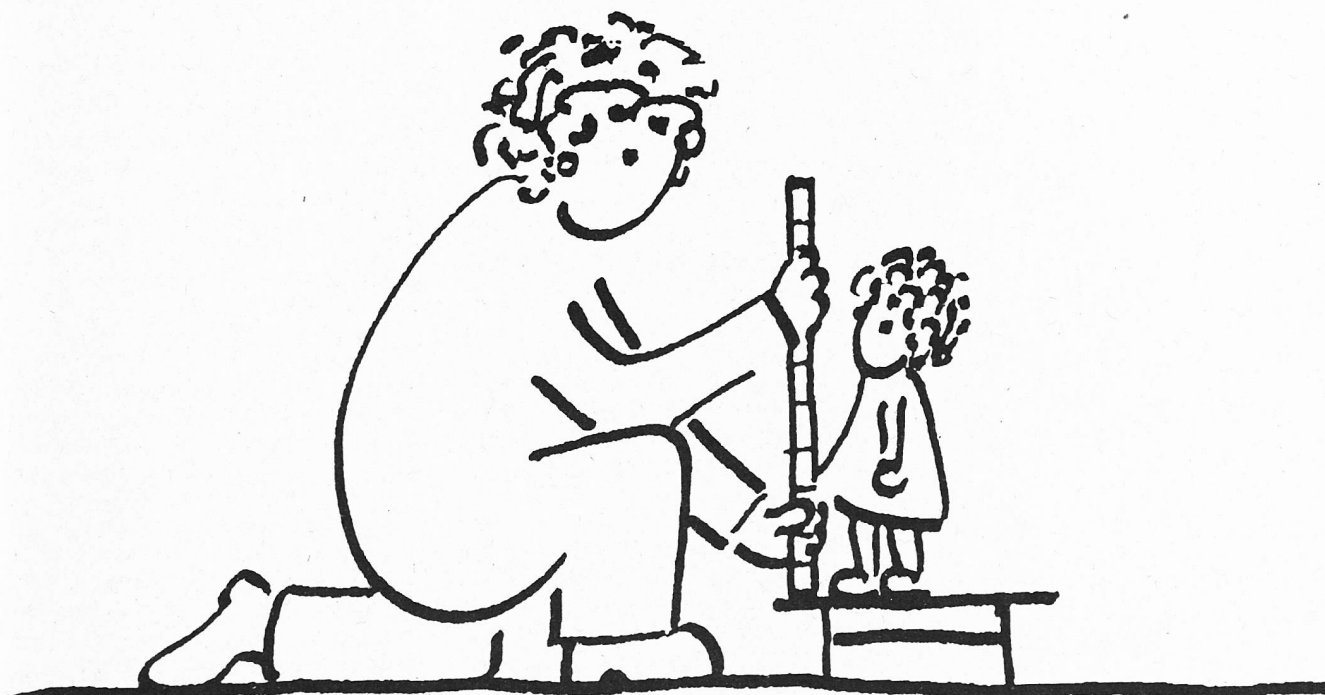
Pädagogisch therapeutische Massnehmerinnen (Karikaturen von Hotensia Florin, Landquart)

«Der Austausch von Informationen und Erfahrungen wirkt sich sehr positiv auf meinen Unterricht aus.»