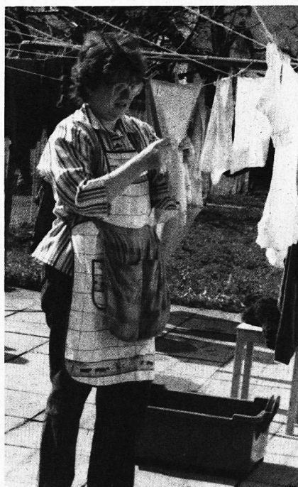
Hauswirtschaft will gelernt sein.