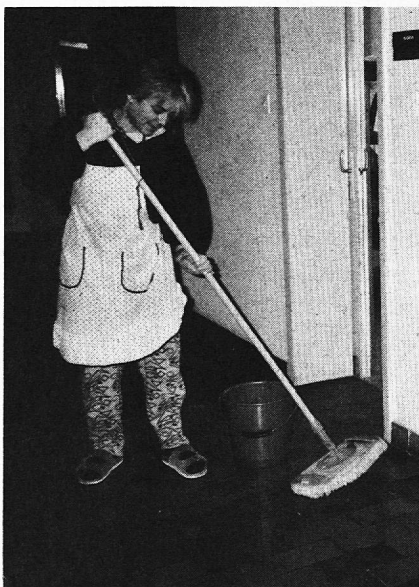
Auch Hygiene ist eine Frage der Haltung.