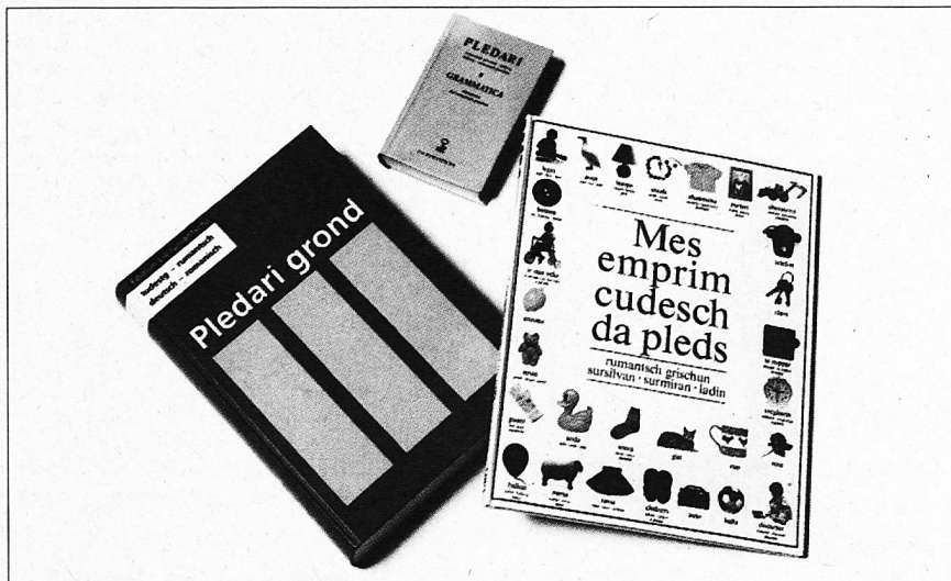
Der Wortschatz bildet die Grundlage einer jeden Sprache.

Das RG hat unterdessen eine starke Eigendynamik entwickelt. So wird die Einheitssprache nicht nur im «plakativen» und «administrativen» Bereich verwendet, sondern hat sich auch auf die Literatur und auf die Medien ausgedehnt. 1991 wurde