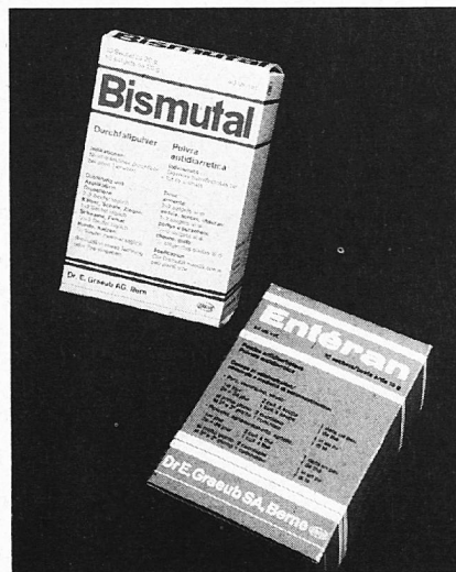
Der Sprachgebrauch ist die beste Sprachpflege.