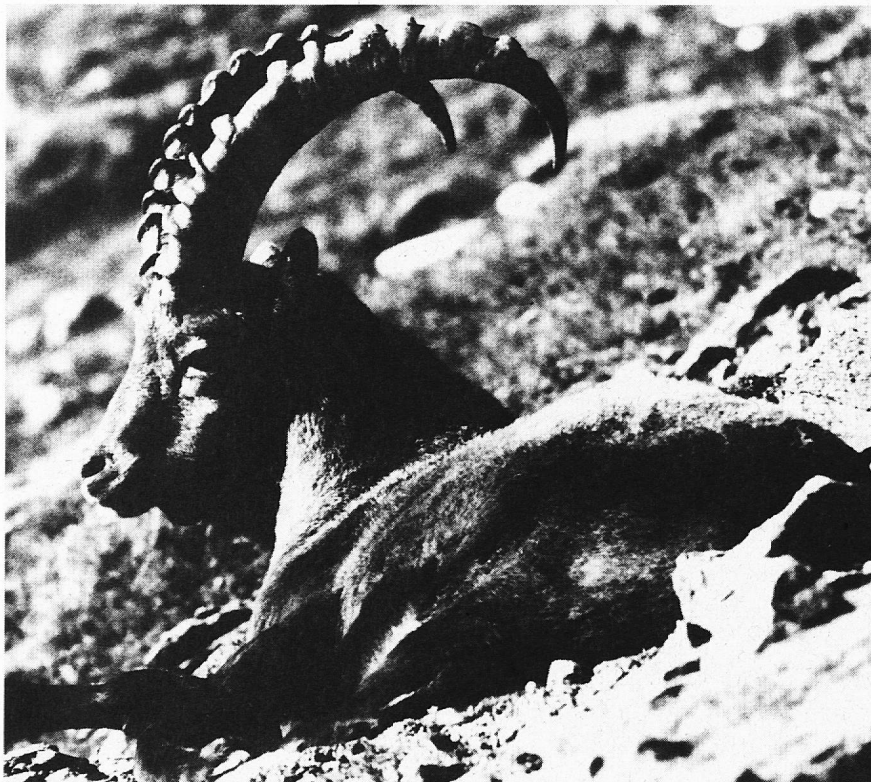
«Jubiläums- und Wappentier»

Öffnungszeiten: Dienstag bis Samstag, 10.00 bis 12.00 und 13.30 bis 17.00 Uhr, Sonntag, 10.00 bis 17.00 Uhr durchgehend, Montag geschlossen.