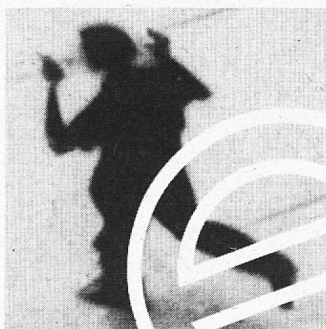
«Flüchtlinge und Asyl»

Gratisprobenummern können an folgender Adresse unverbindlich bestellt werden: Weissensteinstr. 35, CH-4500 Solothurn, Telefon / Fax 065 23 57 07.