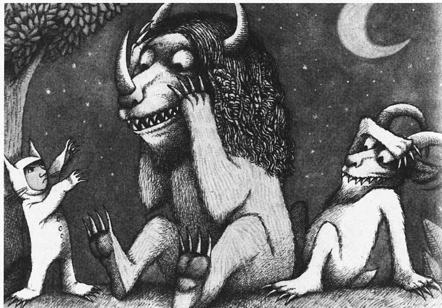
Max, der Zähmende

Deutlich tiefer ist das Vertrauen in die erzieherische Rolle der Schule. Rund 60% der ÖsterreicherInnen, Französischen und Franzosen, SchweizerInnen und AmerikanerInnen haben zumindest «ein gewisses Vertrauen» in die Fähigkeit der Schule, die persönlichen und sozialen Fähigkeiten der Schülerinnen und Schüler zu fördern.