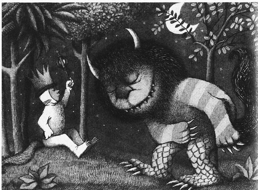
Max, der Herrschende

Eigenverantwortlichkeit verlangt ebenfalls eine Portion Selbstachtung. Wer sich selbst zuwenig achtet, der wird die Verantwortung lieber andern über-