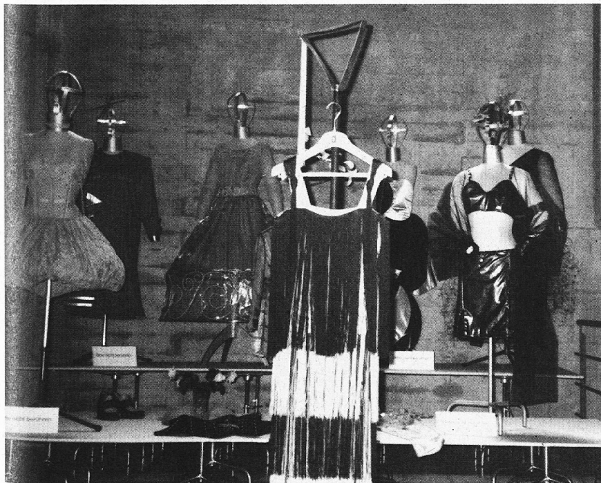
Futuristische Mode aus der Abteilung Lehrgang für Damenschneiderinnen.

Ein unverkennbarer Pioniergeist von Frauen prägt die hundertjährige Geschichte dieser Schule. «Zwei links – zwei rechts» ist der Titel des zum Jubiläum erschienenen Buches. Es öffnet den Blick in die Vergangenheit, die vielleicht noch mit persönlichen Momenten des eigenen Werdeganges verknüpft ist. Diese Schule war stets betroffen, abhängig aber auch einwirkend auf sozialpolitische Zustände und Ereignisse in unserem Kanton. Das Buch kann wärmstens empfohlen werden.