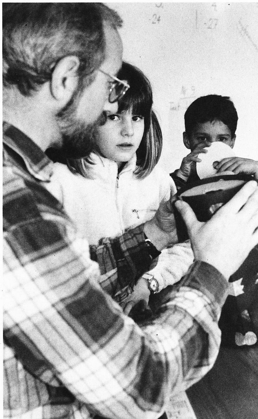
Wie gut, dass der Lehrer alles weiss

So denke ich, dass alle Beteiligten von diesem Praktikum profitieren können.