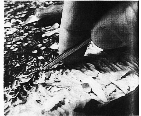
Nur was nicht drucken soll, wird weggeschnitten

Schulunterricht dies auch machen könnten!