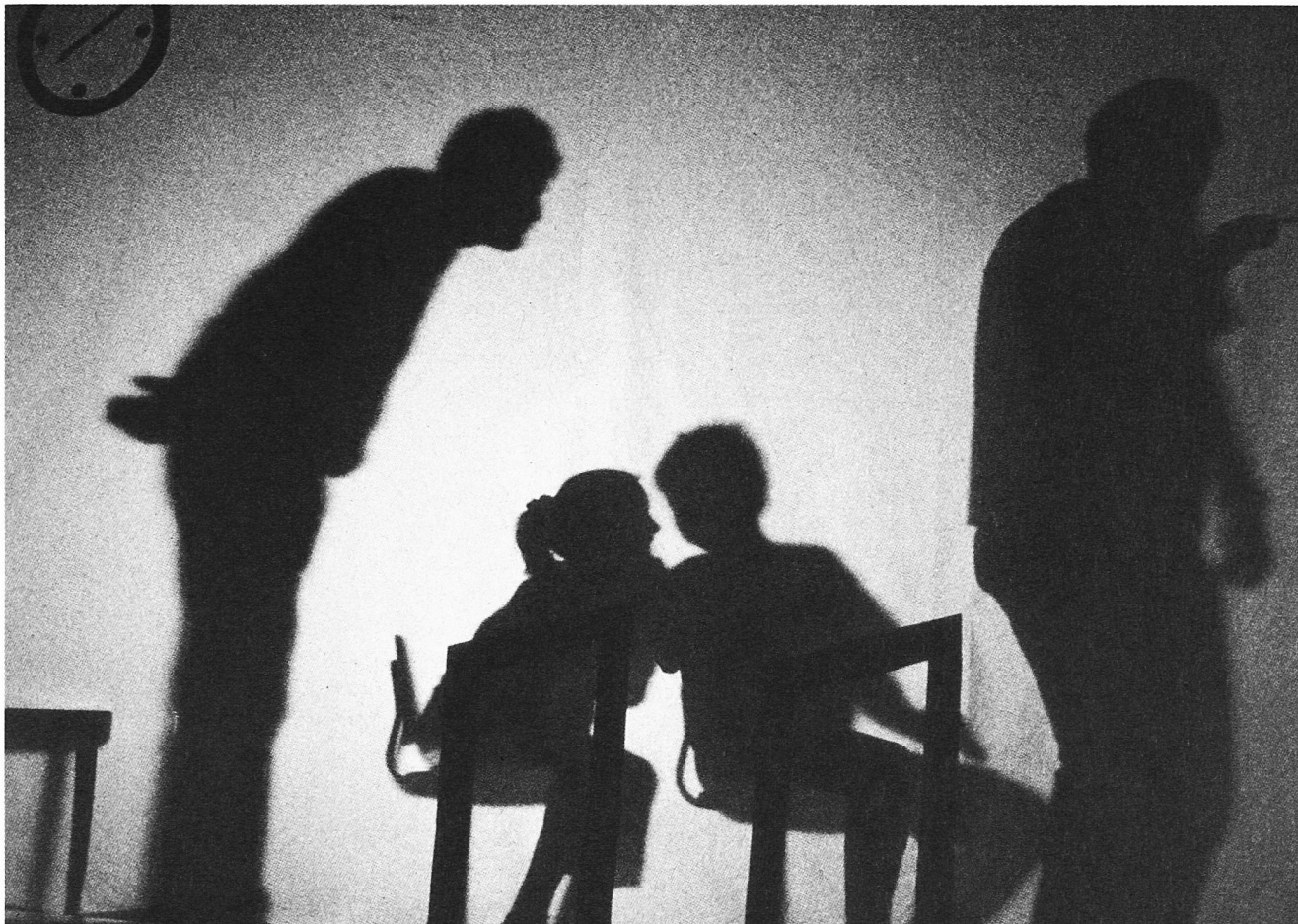
Der Inspektor inspiziert die Schule