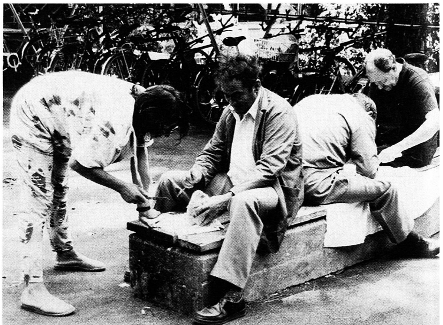
Qualitätsarbeit entsteht gemeinschaftlich und mit Rückendeckung

Für die schulhausinterne Lefo müssen verbindliche Zeitgefässe für das ganze Team geschaffen