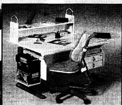
Mit System erweitern.