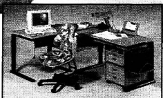
Perfekt organisiert bis zur Endstufe.