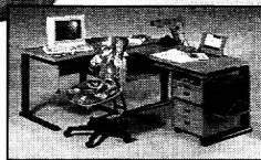
Perfekt organisiert bis zur Endstufe.