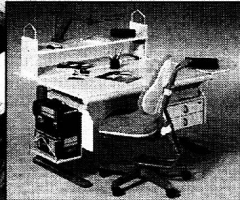
Mit System erweitern.