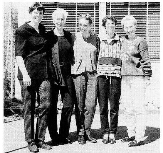
Workshopleiterinnen der Legastheniegruppen