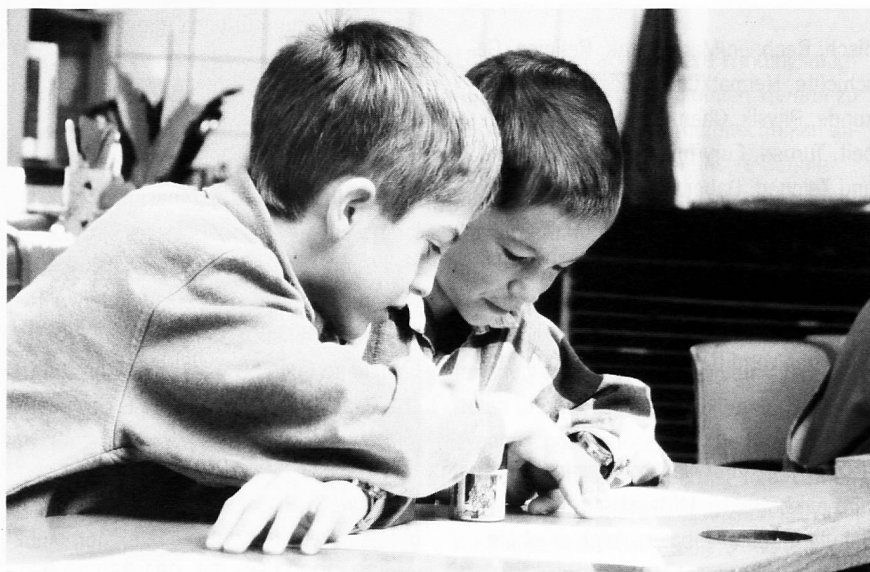
Das gegenseitige Helfen hat einen grossen Stellenwert.

Ein zunehmender finanzieller Druck und eine zunehmende Unmöglichkeit, budgetierte Fehlbeträge auf freiwilliger Basis zu decken, hat zu einem Umschwung in der Elternbeitragsordnung in den meisten Schulen geführt. Für die Eltern wurden sogenannte Richtwerte erarbeitet, die auf dem Einkommen basieren. An die Stelle einer freiwilligen Solidarität trat eine verordnete Solidarität, wie sie jede Bürgerin und jeder Bürger mit der Steuerpflicht (direkte Steuern) kennt. Vom Familieneinkommen betragen die Elternbeiträge an die Schule im Durchschnitt 10-15%. Einzelne Schulen haben dann zusätzlich die beiden Enden, minimaler und maximaler Elternbeitrag betragsmässig festgelegt. Eben