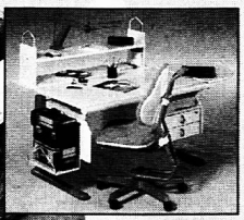
Mit System erweitern.