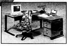
Perfekt organisiert bis zur Endstufe.

Das grösste Möbelzentrum Graubündens und der Ostschweiz