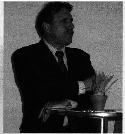
Regierungsrat Claudio Lardi

«Er ist die Empfehlung, die humanistische Orientierung der Bildung durch das Paradigma der Ökonomie zu ersetzen. Oder etwas plakativ und böse ausgedrückt, ist es der Ratschlag, Humboldt durch Christoph Blocher zu ersetzen.»