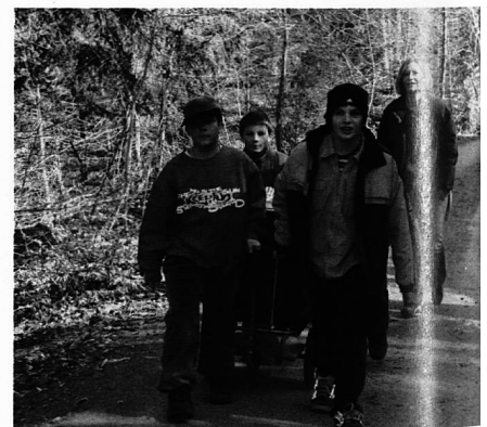
Fein säuberlich in einer Wärmebox versorgt, transportieren die Schüler das Mittagessen auf einem Anhänger einige hundert Meter die steile Strasse von der HTF in die Tagesschule hinauf.