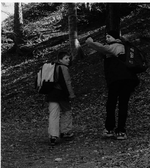
Gut aufgelegt und frei vom Aufgabenstress verlassen die ersten Schüler am Abend die Tagesschule in Richtung Postauto-Haltestelle etwas oberhalb der Schule.

Die Fahrzeit zwischen dem Bahnhof Chur und der Haltestelle Passugg-Araschgen «alte Post» beträgt zehn Minuten. Gefahren wird in der Zeit von 07.15 bis 20.15 Uhr im Stundentakt. Für die Fahrstrecke zwischen der Haltestelle «alte Post» und dem Bahnhof benötigt das Postauto 13 Minuten. In dieser Fahrtrichtung verkehren in der Zeit zwischen 7.15 Uhr und 18.35 Uhr neun Kurse.