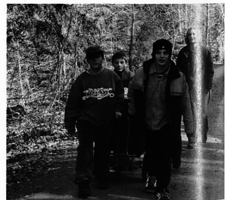
Fein säuberlich in einer Wärmebox versorgt, transportieren die Schüler das Mittagessen auf einem Anhänger einige hundert Meter die steile Strasse von der HTF in die Tagesschule hinauf.