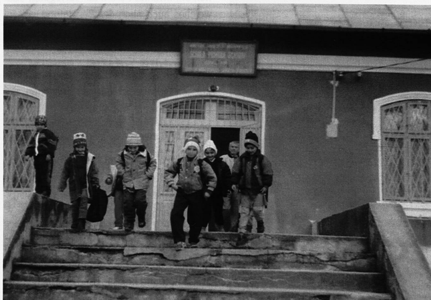
Primarschüler in Targoviste, Rumänien, vor ihrem Schulhaus